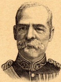
Lord Roberts de Kandahar

ataque directo, necessariamente mortifero, e de exito contingente. Agora, porém, não tiveram duvida em tental-o, e se o fizeram foi, de certo, por estarem convencidos de não ser já possível á guarnição o prolongar por muito tempo a resistencia. A noticia da capitulação de Ladysmith, ou da sua tomada á viva força, se nos