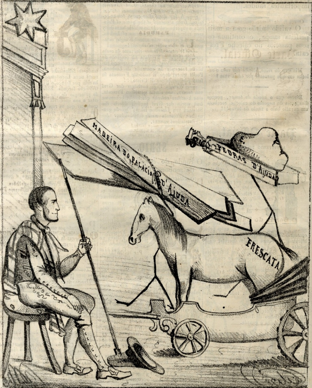
O ERDEIRO DESTE PAIZ.

NA OFFICINA DE MANOEL DE JESUS COELHO Rua do Poço dos Negros n.º 56.