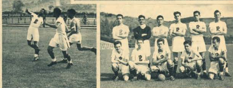
Entre o Liceu D. João de Castro e os Pupilos do Exército disputou-se a final do torneio regional de andebol. Triunfaram os primeiros cuja equipa publicamos em cima. Ao lado uma movimentada fase. Em baixo o grupo dos Pupilos