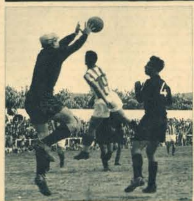
Os setubalenses triunfaram por 8-1 contra os académicos de Coimbra. A sua exibição agradou, e Capela viu-se obrigado a defender fartas vezes, como se verifica nestas duas fases.