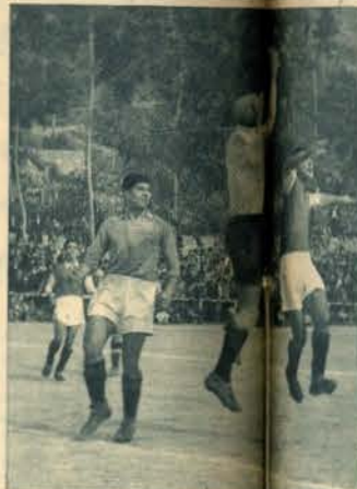
Sério, na defesa de uma bola alta