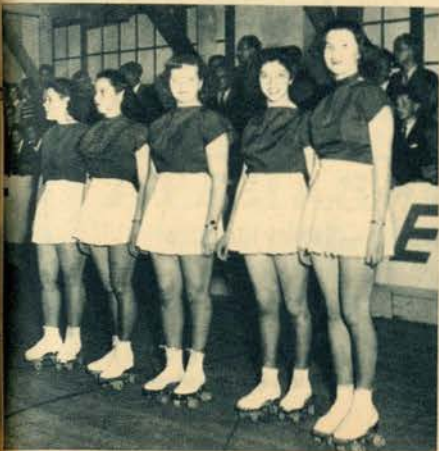
Sorrisos sádios, alegres, completam a beleza da equina feminina da Suíça no erinaceus