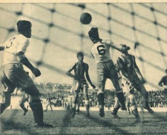
Na frente da baliza famalicense, luta-se arduamente