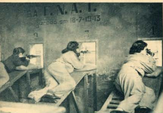
Um aspecto da Carreira de Tiro da F. N. A. T. durante um treino de algumas das concorrentes que no sábado começam a disputar o primeiro campeonato organizado para senhoras, à distância de 50 metros

Do referido Calendário consta ainda um Campeonato de Voleibol. Embora se trate de primeiras iniciativas — o movimento é animador. As raparigas trabalhadoras accorrem justificando as organizações da F. N. A. T.