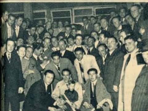
Os hoquistas nacionais, à chegada ao Aeroporto. O ambiente é de alegria. Todos o demonstram