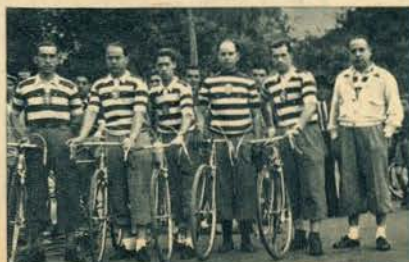
As secções de ciclo-turismo do Benfica e do Sporting estão em plena actividade. Isso mesmo o demonstraram no domingo disputando a sua prova de regularidade. Em cima: a equipa do Benfica, em baixo a do Sporting