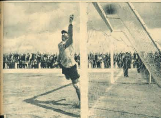
Os campeões covilhanenses, no seu campo, derrotaram os cufes do Barreiro, por 4-1, classificando-se para os 4.ºs de final. Das duas fases do encontro — dois tentos — a equipa da serra.