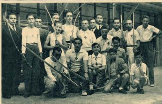
O Lisboa Ginásio organizou um interessante torneio de tiro ao arco. Publicamos o grupo dos concorrentes e ao lado o gentil grupo das atiradoras