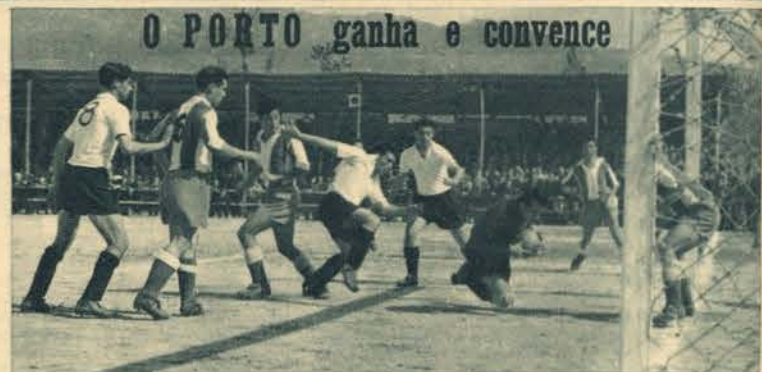
Barrigana, entretanto, não esteve parado. Os vimaranenses venderam cara a derrota. O guarda-redes do F. C. Porto está aqui em pleno movimento...