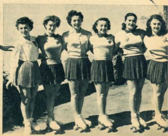
Um interessante friso de patinadoras italianas