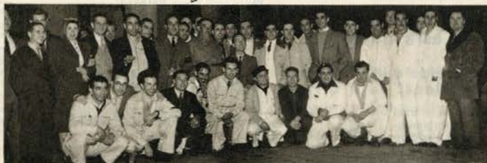
Os concorrentes que partiram de Lisboa