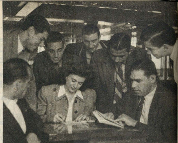
No hotel há horas vagas... Os jogadores aproveitam-nas com uma hóspeda espanhola que aprende a escrever português. Há muitos professores à sua volta...