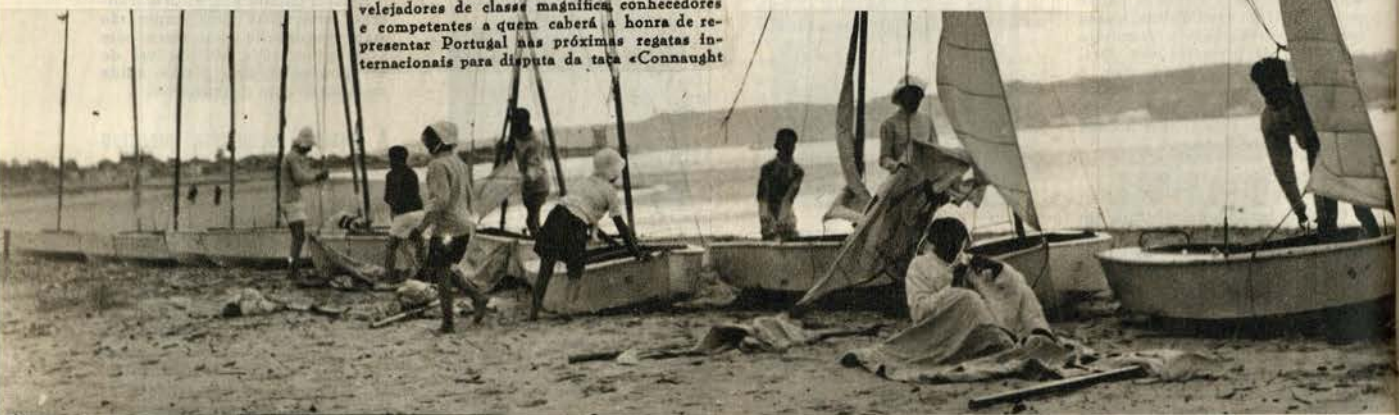
Manhã cedo os «lusitos», futuros grandes velejadores, começam a sua faina. Desejosos de guiarem os seus afrosos barquitos sobre as águas do Tejo procedem lesto à aparelhagem dos barcos que lhes estão distribuídos