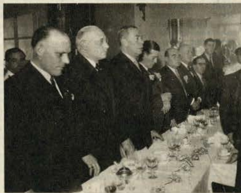
O Benfica festejou com entusiasmo o seu 43.º aniversário. Na última semana, incluído no respectivo programa, ofereceu o semandrio do clube «Sport Lisboa e Benfica» um banquete aos sócios com mais de 25 anos, e o facto serviu para se produzirem afirmações de fé no futuro da popular colectividade