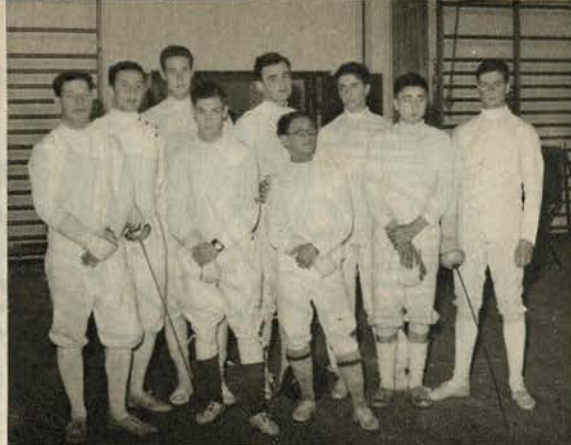
Os esgrimistas da M. P. representando o Douro Litoral, Estremadura e Alto Alentejo, que disputaram o Campeonato Nacional de Esgrima (Espada)