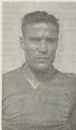
PATALINO, autor dos dois pontos de Portugal B