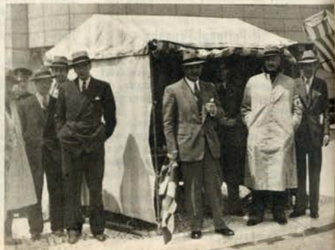
Directores do A. C. P. no controle da Praça do Império