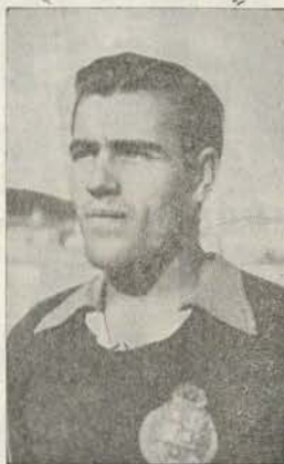
BARRIGANA, que leva boa parte em Bordéus