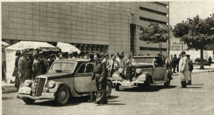
Dois concorrentes chegam ao controle de Lisboa