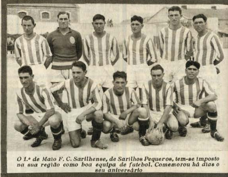
O 1.º de Maio F. C. Sarilhense, de Sarilhos Pequeros, tem-se imposto na sua região como boa equipa de futebol. Comemorou há dias o seu aniversário