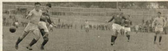
ESTORIL-ORIENTAL — Vieira prepara-se para um remate, perturbado por um defesa adversário