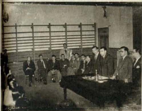
O Oriental tem nova direcção. O acto da posse dos dirigentes do nòvel clube serviu para se trocarem afirmações interessantes. A brlosa colectividade do Poço do Bispo tem já uma história no desporto nacional, e por certo a vai continuar dedicadamente