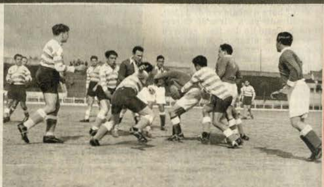
O S. L. Benfica ganhou novamente o campeonato regional de «rugby». O quinze do Campo Grande ganhou o campeonato com inteira justiça. Publicamos neste número a sua equipa, e ao lado uma fase do seu jogo contra o Sporting

O S. L. BENFICA é CAMPEÃO de LISBOA de "RUGBY"