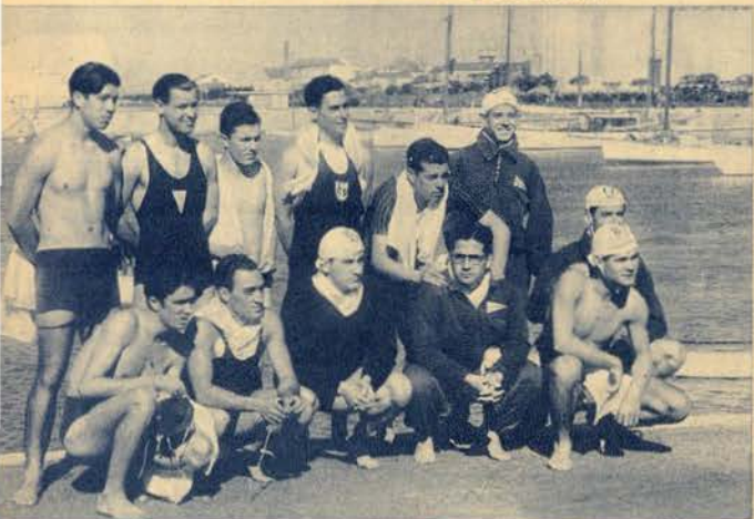
Os concorrentes à prova dos 1.500 metros, disputada ao longo da muralha da Junqueira, e organizada pela Associação de Natação de Lisboa