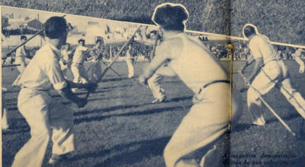
As magníficas demonstrações de jogo do pau por parte dos atletas