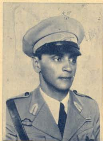
Luanda tem as suas tradições no tempo desportivo. Já o temos afirmado várias vezes. Publicamos neste número, em baixo, um aspecto do Estádio da cidade, que a Camara Municipal vai arranjar, colocando-o em condições magníficas. O sr. Comandante Manuel Magno Romão, presidente da Camara e comandante da Polícia de Angola, e cuja fotografia publicamos, tem-se esforçado para que assim suceda