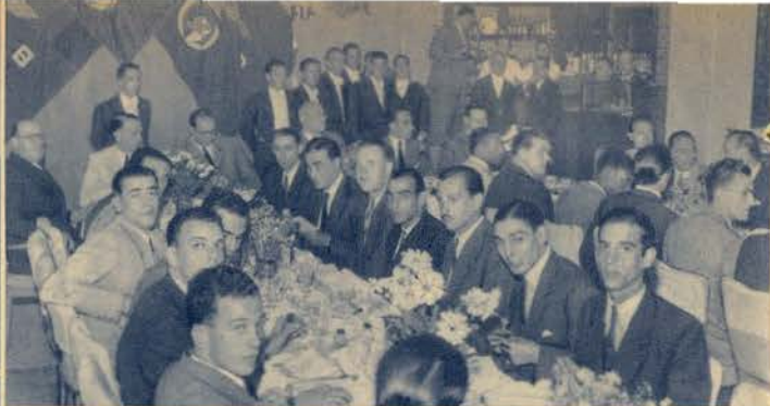
Um aspecto da homenagem do Sport Lisboa Benfica aos seus campeões nacionais e regionais de basquete, atletismo, ténis de mesa, andebol e hóquei em campo