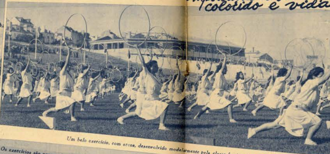
Um belo exercício, com arcos, desenvolvido modelarmente pela classe feminina da F. N. A. T.