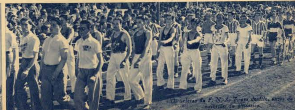
Os atletas da F. N. A. T. em desfile, antes da execução de ginástica