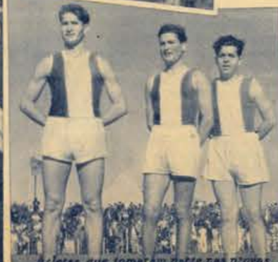
Atletas que tomaram parte nas provas