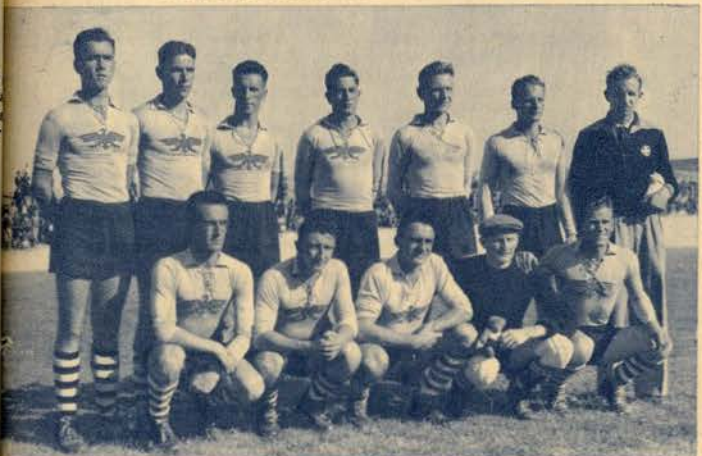
Aarau, o grupo suíço que brilhantemente derrotou o team da Associação do Porto