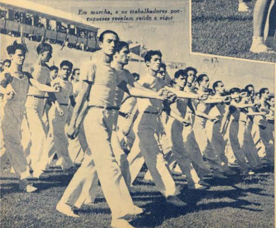
Em marcha, e os trabalhadores portugueses revelam saúde e vigor