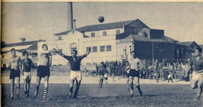
Um lance de defesa junto das balizas dos Suíços

N.º 190 * 24 DE JULHO DE 1946 * PREÇO 2$00