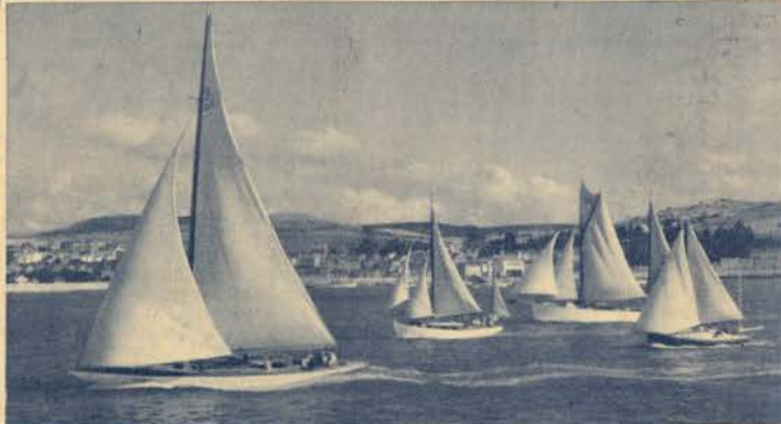
A largada para a disputa da taça Wintermantel, na regata Lisboa-Setúbal