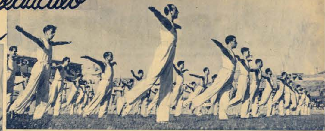
A classe masculina de trabalhadores num exercício pleno de beleza e harmonia