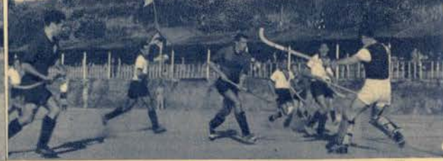
Ao lado — O Grupo de Futebol Benfica que conquistou a Taça de Portugal de hóquei em campo. Em cima: Numa fase animada do encontro, em que os lisboetas evidenciaram superioridade, derrotando o Académico, do Porto, por 4-0