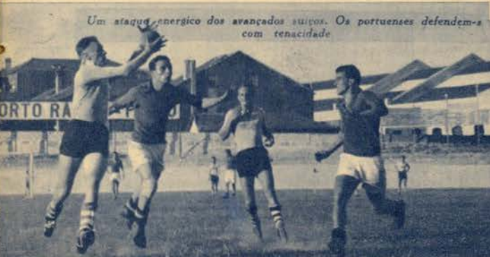
Um ataque energético dos avançados suíços. Os portuenses defendem-se com tenacidade