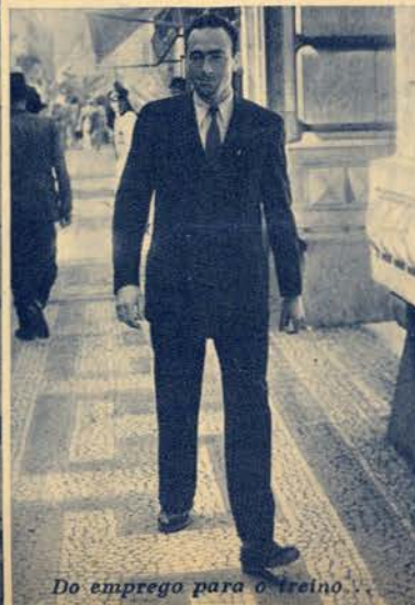
Do emprego para o treino.