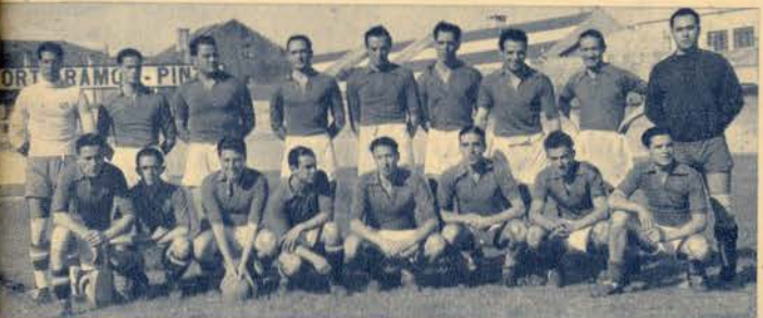
A selecção portuense de andebol, com efectivos e suplentes