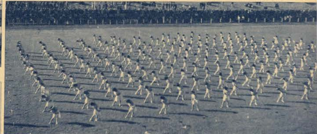
Um conjunto da classe feminina das trabalhadoras portuguesas que se exibiu com agrado absoluto

VISTOSO e alegre o conjunto do Festival de Educação Física em que tomaram parte os desportistas e as classes de ginástica, feminina e masculina, dos vários cursos de trabalhadores da Fundação Nacional para o Trabalho.