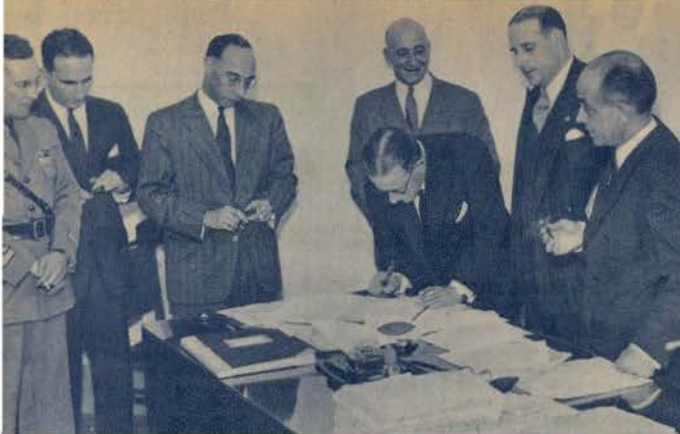
O acto de posse da nova Comissão Administrativa da Federação Portuguesa de Futebol perante o Sr. Director Geral dos Desportos