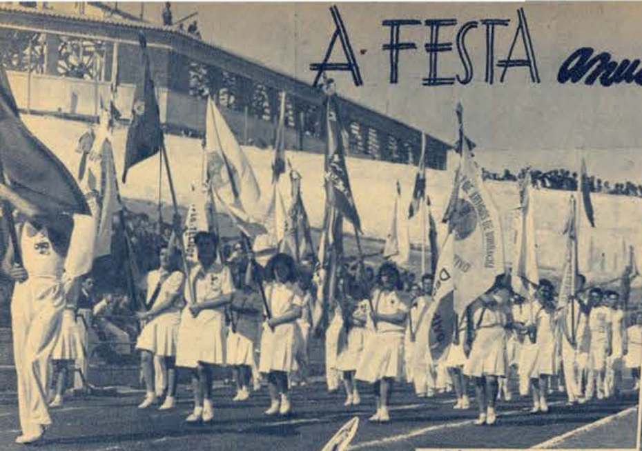
O cortejo dos estandartes conduzidos por gentis raparigas