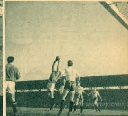
Toda a defesa do Atlético rodela e protege o guarda-rédes