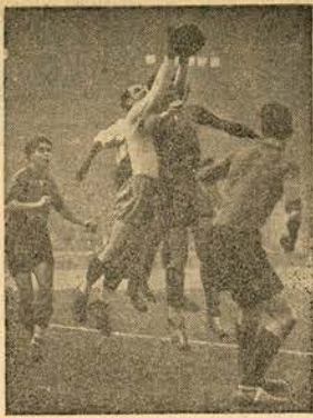
Campeonato de França de futebol — Uma fase do encontro «Racing-Rennes», que o primeiro daqueles clubes venceu.