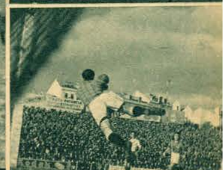
Apresentamos mais uma bela imagem de Correia, um guarda-rédes de futuro