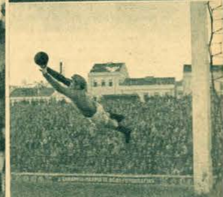
A agilidade é indispensável num guarda-rédes. Correia como que vós...