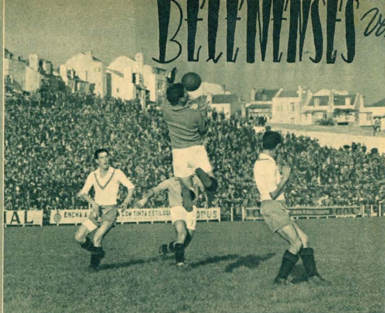
A boa colaboração da defesa do Atlético revela-se neste lance, sob o perigo de um atacante de Belém. O futebol é um jogo de conjunto