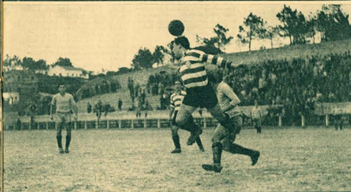
Cordeiro, o último reforço sportinguista num lance de cabeça