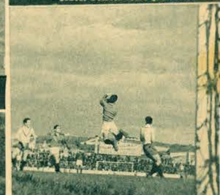
Num salto magnífico, Correia salva as suas balizas, livrando-se do perigo de Elói