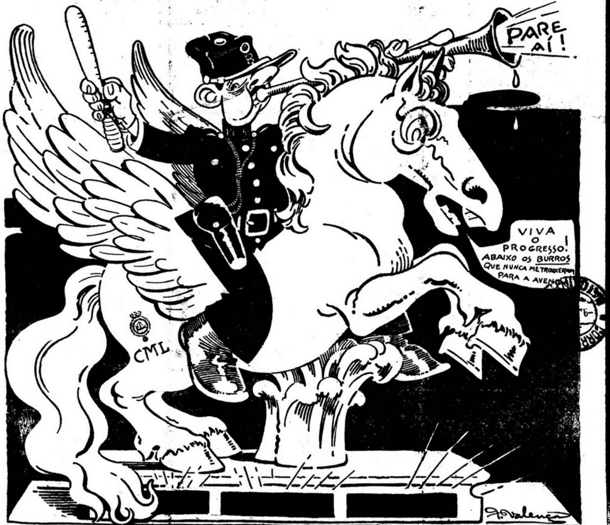
A C. M. L. teve a genial ideia de mudar para a Avenida as estatuas de Queluz. Como genio puxa genio, Sempre fixe propõe o aproveitamento dos corceis para a policia montada.