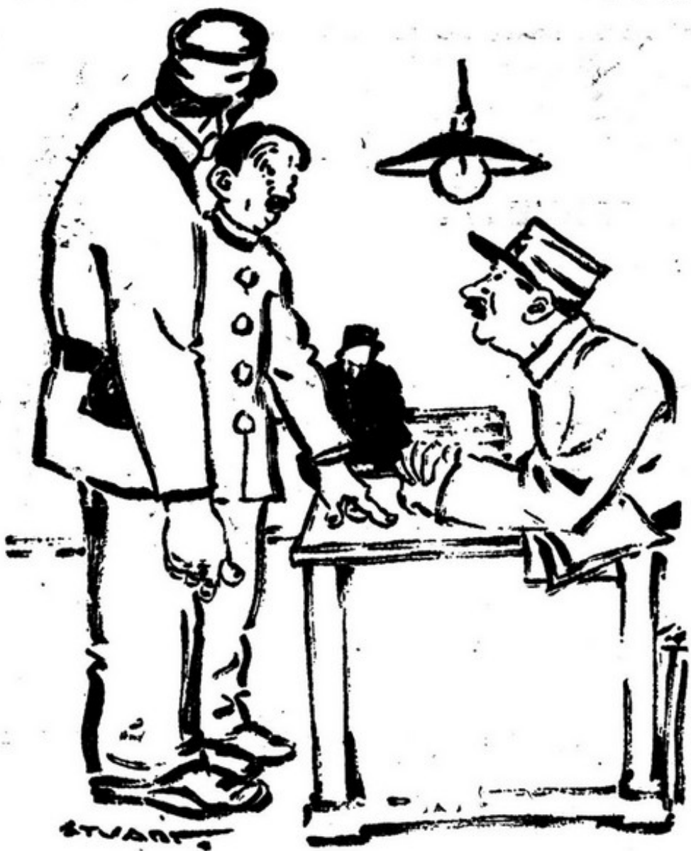
- Saiba o meu chefe que o político que me mandaram prender la fardado e vai eu intão não no prendi. - Você é uma besta. Prendia-o e cinsurava-lhe a farda.