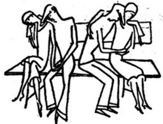
E foi este o momento mais terrível, em que se decidia ao mesmo tempo a felicidade de quatro pessoas. (Continúa).