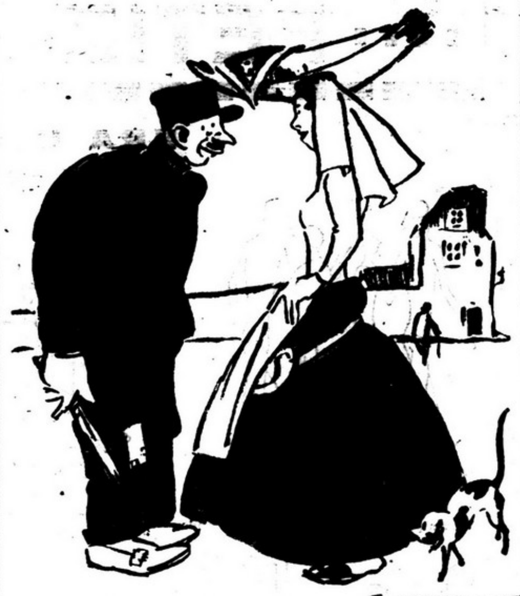
- Agora não são só vocês que tem peixe espada. Nós também o temos, mas não o vendemos, damos-lo.