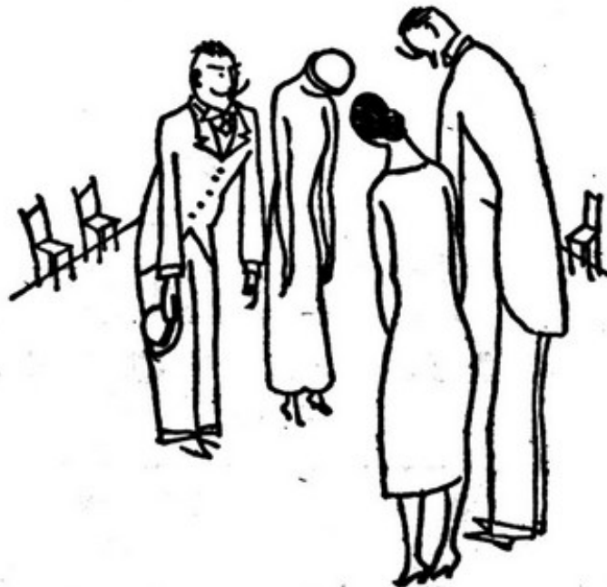
Até que se encontraram os pais dos dois irmãos com os pais das duas irmãs.