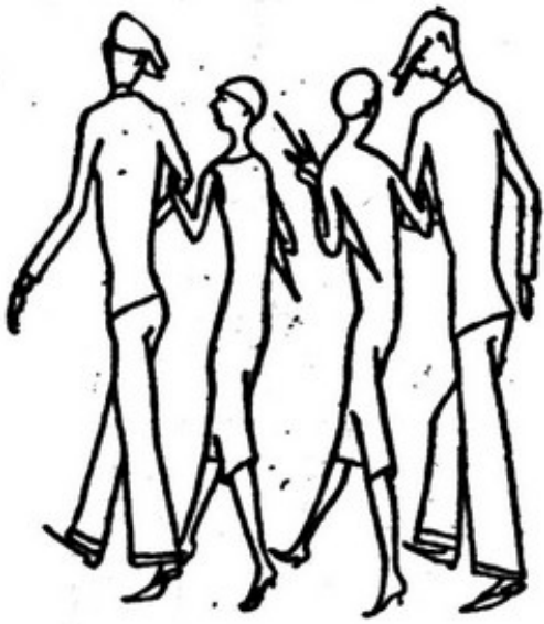
Vieram depois acompanhá-las a casa ... tendo