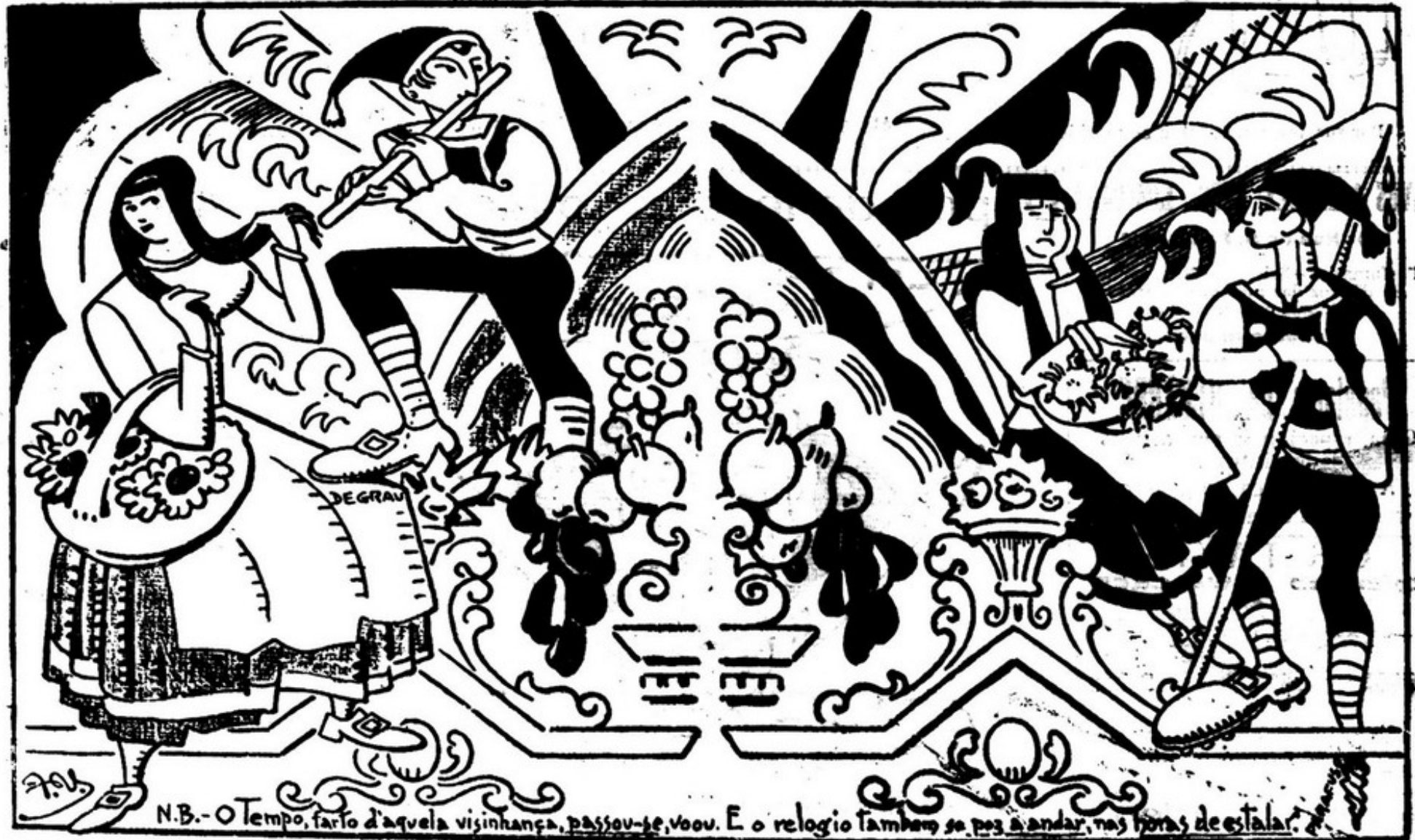
N.B.- O Tempo, farto d'aquela vizinhança, passou-se, voou. E o relógio também se pôz a andar, nas horas de estalar.

Do lado esquerdo: - Uma saiola (?) grávida, penteia-se a dedo, enquanto um saiolo (?) cheira uma flauta. Do lado direito: - Outra saiola (?) com d'ôres de dentes, vende santolas, enquanto outro saiolo (?) se trespassa... (barato) num cajado. Os fundos são em scenografia de Renda... de Peniche.