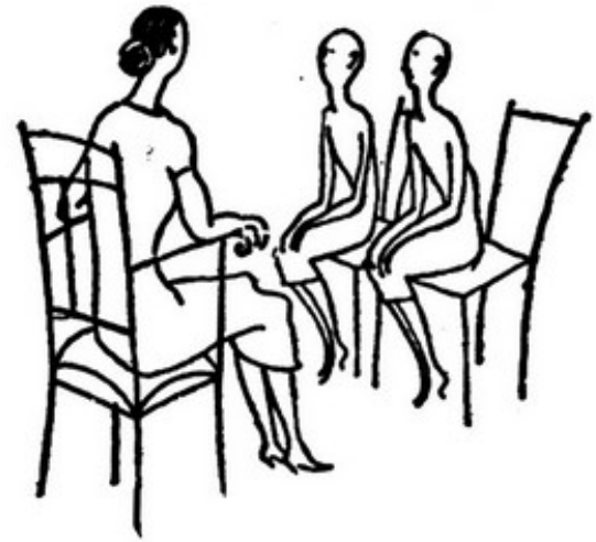
Timidas, as duas irmãs falaram primeiro à mãe.