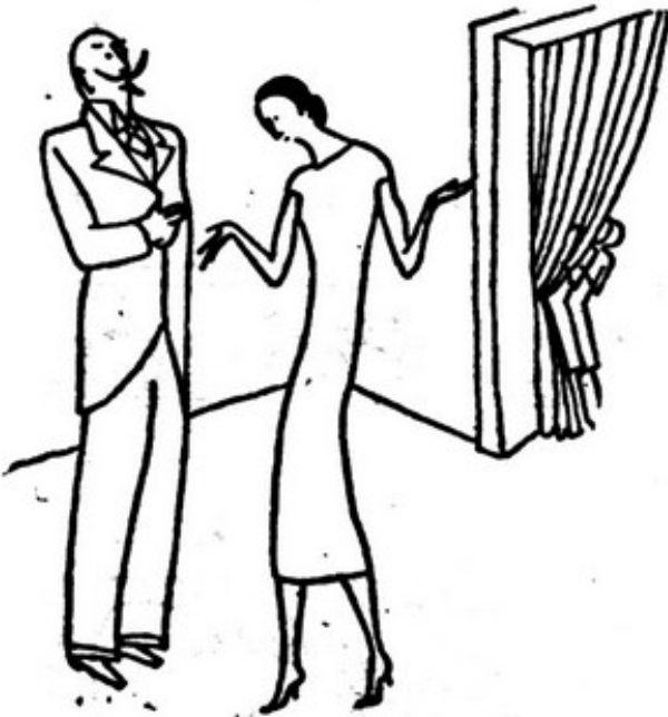
Por sua vez, a mãe falou ao marido.