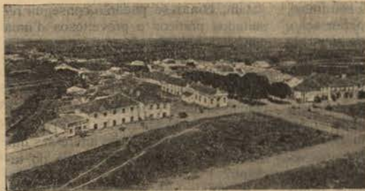
MAFRA - VISTA GERAL

Foi, porém, durante o reinado do Rei-magnanimo, que essa fidalga vila se coroou do maior esplendor. A sua escolha para depositaria do grandioso monumento que synthetisa uma era de grandeza e a superstição que a liga ao acontecimento historico que é evocado por esse mesmo monumento, deram-lhe motivos para a sua especial consagração. Assim, Mafra, que albergou dentro dos seus muros a enorme população que foi empregada na construção do seu soberbo Convento, viu, tambem, brilhar as pa-