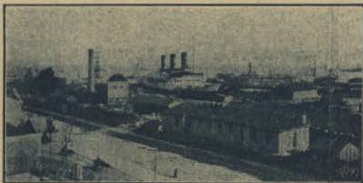
PORTO DE LISBOA—O paquete LUTELIA de 18.000 toneladas na grande doca em Alcântara

minho de ferro supplantar a rapidez d'aqueles pontos á capital hespanhola, do que de Lisboa, não havendo mesmo concorrência n'aquella linha, que possa permitir o fazer um comboio rapido diario como acontece com a nossa capital.