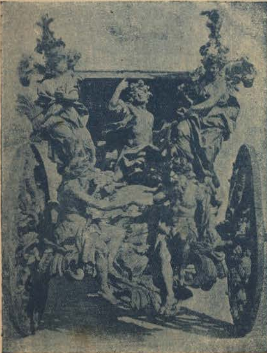
MUZEU DOS COCHES— O carro triumphal

mas os estrangeiros, possam aprender, es-