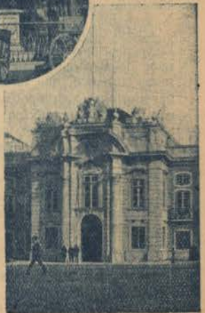
Entrada e uma sala do Museu da Artilharia

dos grandes atractivos da população fluctuante que n'ela encontra a mais captivante hospitalidade. As galerias artisticas da Italia, são, por assim dizer, conhecidas não só pelos seus nativos, mas por todo o mundo. E na Inglaterra, na America, no Brazil—emfim, por toda a parte onde o egoismo do estudioso e a ancia do espirito se recreiam mais com as realidades productivas do que com o prazer das phantasias ephemeris, se patenteia aos olhos de todos, as reliquias inestimaveis de cada povo, onde se reflecte um quadro da sua historia ou a tradução do seu genio artistico ou in-