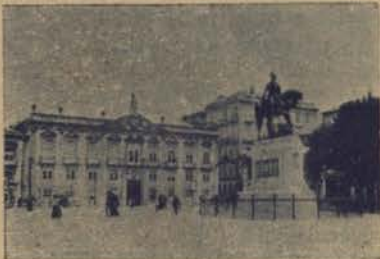
PORTO—Camara Municipal agora demolida

Theatros e cinemas não faltam, ha-os para todos os gostos; desde o grande Theatro de S. João, que se ergue, sobre as ruinas que o incendio deixou, com a sua fachada monumental, tomando-o um dos mais belos