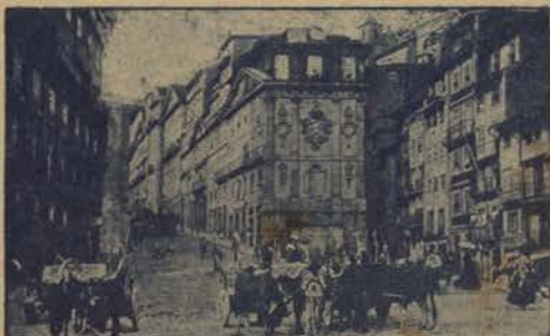
PORTO Rua de S. João

A' frente d'uns quintaes, ha uma casa severa, com uma porta conventual, que se abre pesadamente, deixando ver n'uma compostura digna de uma boa arumadeira, um conjunto de coisas nacionaes, que deslumbra. Todos os moveis, todos os ornatos, são no velho estylo portuguez e as meninas tão rosadas e frescas, como rosas a desabrochar, denunciam a viveza, e alegria tão salutar que só um sol como o nosso, que batia sobre as largas janelas, pode doirar e aquecer.