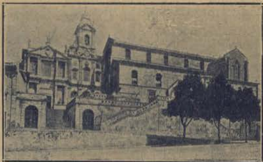
PORTO Igreja de S. Francisco

Ha os abrindo só para o commercio, só para a industria. Querem trabalho querem coisas vivas.