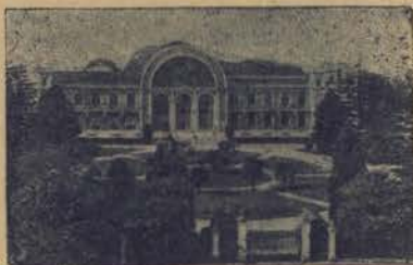
PORTO - PALACIO DE CRISTAL

Não sei se aos leitores acontece o mesmo, a nós as amabilidades, que os mil e um servos á chegada dos