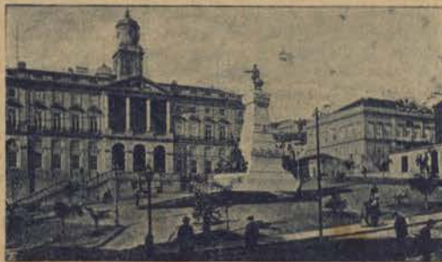
PORTO - Palácio da Bolsa e Estatua do Infante D. Henrique ria patria pelo habil pincel de Colaço.

A's 4 e meia chegámos ao Porto, á monumental estação, onde em admiraveis paineis vemos desenhada a histo-