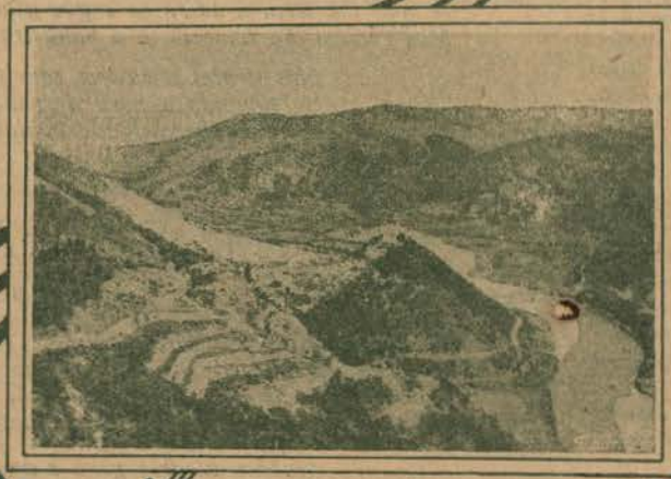
VISTA DE PERACOVA

admiravel cinzel rendilhador da pedra: Affonso Domingues.