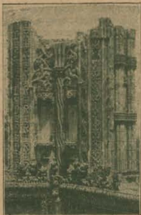
UM TRECHO DAS CAPELAS IMPERFEITAS

logo que lhe tirassem os simples. Mas não derruiu, e mestre Domingues, ficando sob ella os tres dias do seu voto, succumbiu de inação, mas demonstrando ao estrangeiro quanto valia a palavra lusitana.