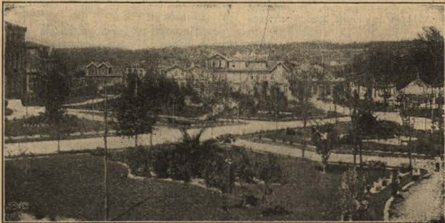
SANTO TIRSO - JARDIM

Como que para melhor nos fazer comprehender o logar de Jestaque que lhe reservava, essa Natureza — noiva amantissima da Terra Portuguesa — obriga-nos, quando de longe, a contemplar em pedestal mais elevado esse