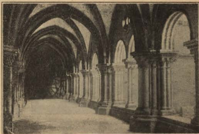
COIMBRA SÉ VELHA — Claustro

das mais bellas e typicas produções que em Coimbra deixou essa brilhante pleiade de artistas, portadores da delicada arte da Renascença francesa, que á cidade do Mondego attrahiu o espirito faustoso de D. Manuel e cuja in-