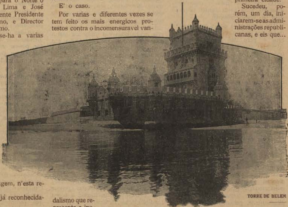
TORRE DE BELEM