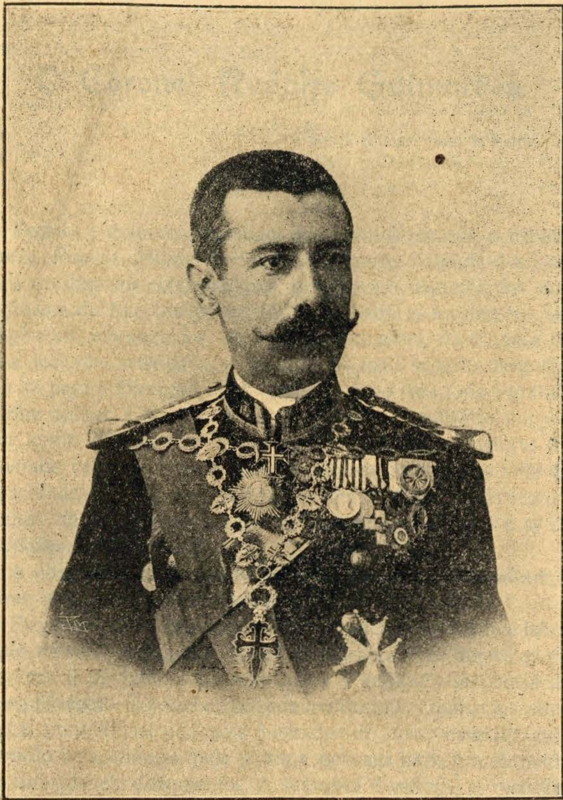
Coronel Rodolfo Guimarães