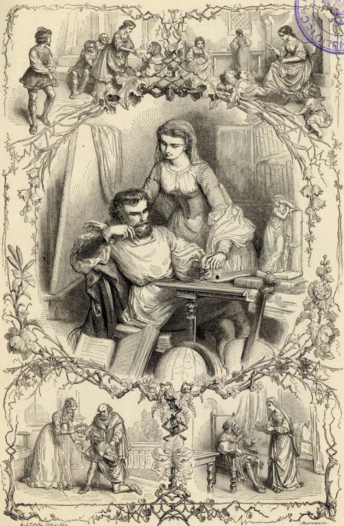
O Poder das mulheres. Gravura do Magasin pittoresque .