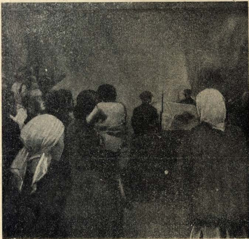
A romagem ao tumulo de Lenine

Ultimamente o cadaver de Lenine tem sido alvo de varias e extranhas manobras. Como se sabe o «Tzar-Vermelho» da Russia, o unico revolucionario do mundo que morreu no letto (os outros morreram] sempre carbonizados pelas ultimas labaredas da fogueira que acenderam), é adorado pelo povo, como se fosse uma imagem sagrada. Embalsamado, logo apoz