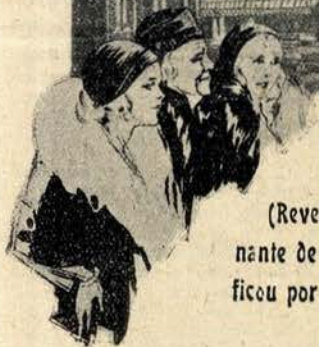
Conheci aquela família

(Revelação emocionante de um crime que ficou por descobrir)