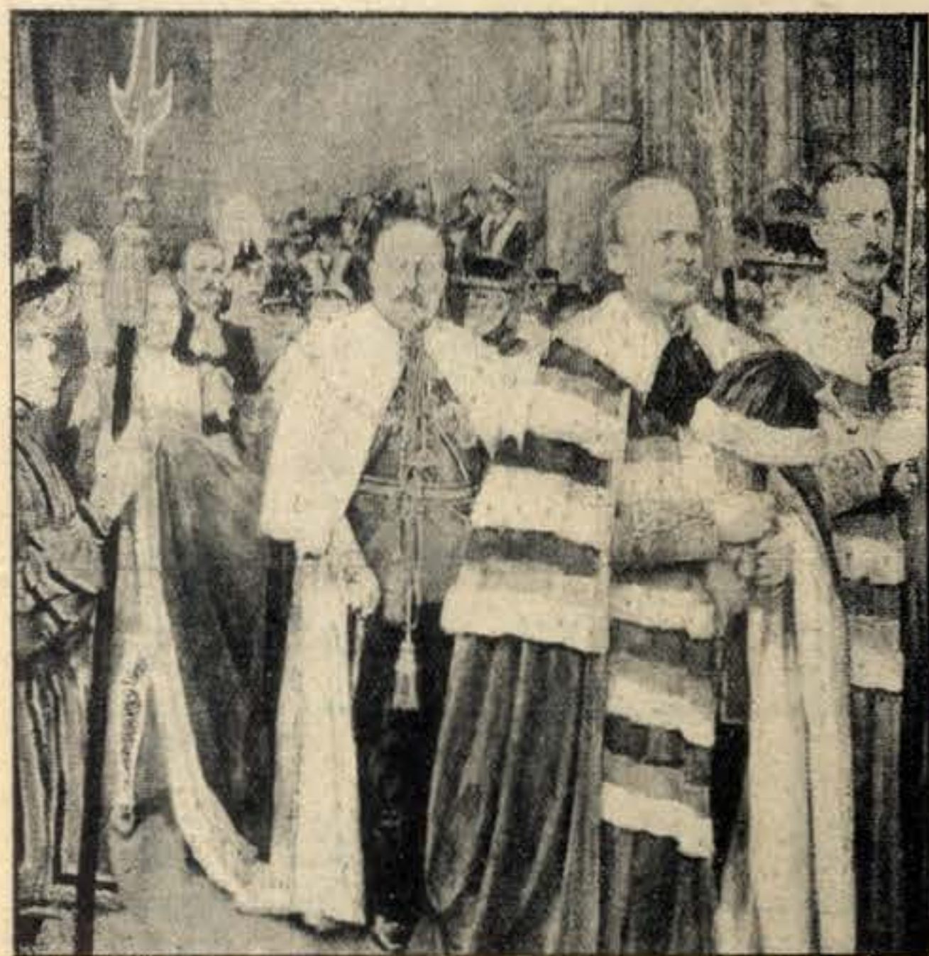
A abertura solene do Parlamento inglês com a tradicional pompa e trajos no reinado de Eduardo VII

O grande assunto do dia é, sem dúvida, o projecto da Nova Constituição que o Governo apresentou ao país. A liberdade absoluta com que foi concedida a discussão desse projecto, o entusiasmo e largueza com que a Imprensa a tem tratado e ainda o interesse nacional que ela logicamente, oferece a todos os portugueses — impunham ao nosso jornal uma reportagem inédita, que correspondesse a essa oportunidade. A Nova Constituição significa, naturalmente, um regresso ao regimen Parlamentar — embora dentro de outros moldes sob novos principios. Realise-se pois uma reportagem de memória pelo passado; percorra-se, com o espirito, os Parlamentos de todos os países e de todas as épocas; recordemos as suas glórias e as suas fraquezas, as suas virtudes e os seus defeitos. E' este o nosso unico objectivo — nem outro podia ser — ao escrevermos a prosa que se segue: