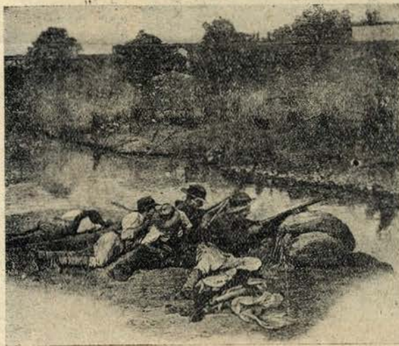
Aspecto da guerra anglo-boer. Uma guerrilha boer sustendo sozinha o avanço de uma coluna britânica

Entre a raça Boer e a inglesa há uma grande diferença que é bom levar sempre em conta. Na primeira entram em mistura os sangues francês, flamengo, alemão e holandês e nada, nem mesmo um globo, de sangue saxão. A segunda no seu puritanismo, não querendo cruzar o seu sangue com o de outras raças, numa altivez que tem mais de apolitica, que de sensata, cria dificuldades sem par na sua forma de governo e admira-se quando os povos que estão debaixo do seu dominio quebram as algemas, os grilhões que as oprimem e proclamam a Liberdade, o direito de se governarem sem tutelas de outrem.