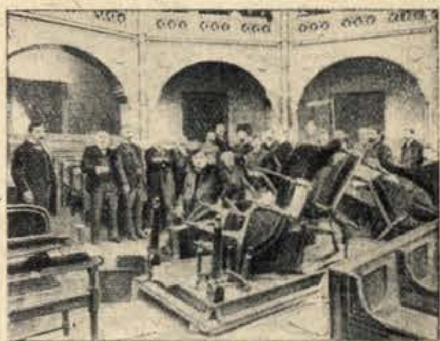
Depois de uma sessão tempestuosa no parlamento francês: os destroços e os causadores

O grande assunto do dia é, sem dúvida, o projecto da Nova Constituição que o Governo apresentou ao país. A liberdade absoluta com que foi concedida a discussão desse projecto, o entusiasmo e largueza com que a Imprensa a tem tratado e ainda o interesse nacional que ela logicamente, oferece a todos os portugueses — impunham ao nosso jornal uma reportagem inédita, que correspondesse a essa oportunidade. A Nova Constituição significa, naturalmente, um regresso ao regimen Parlamentar — embora dentro de outros moldes sob novos principios. Realise-se pois uma reportagem de memória pelo passado; percorra-se, com o espirito, os Parlamentos de todos os países e de todas as épocas; recordemos as suas glórias e as suas fraquezas, as suas virtudes e os seus defeitos. E' este o nosso unico objectivo — nem outro podia ser — ao escrevermos a prosa que se segue: