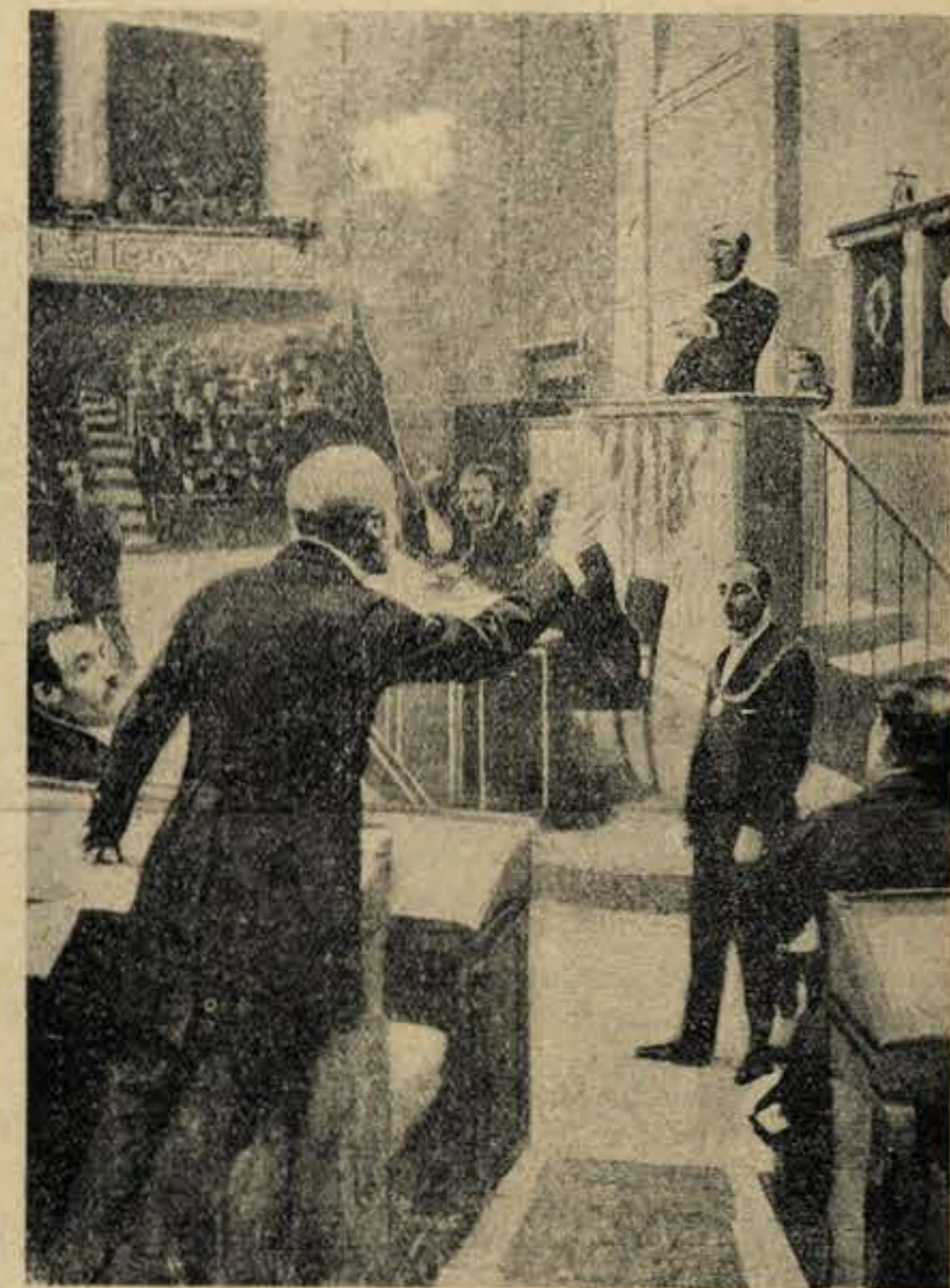
Uma sessão célebre na historia dos parlamentos: Clémenceau pronuncia o famoso ataque sobre a questão do Panamá