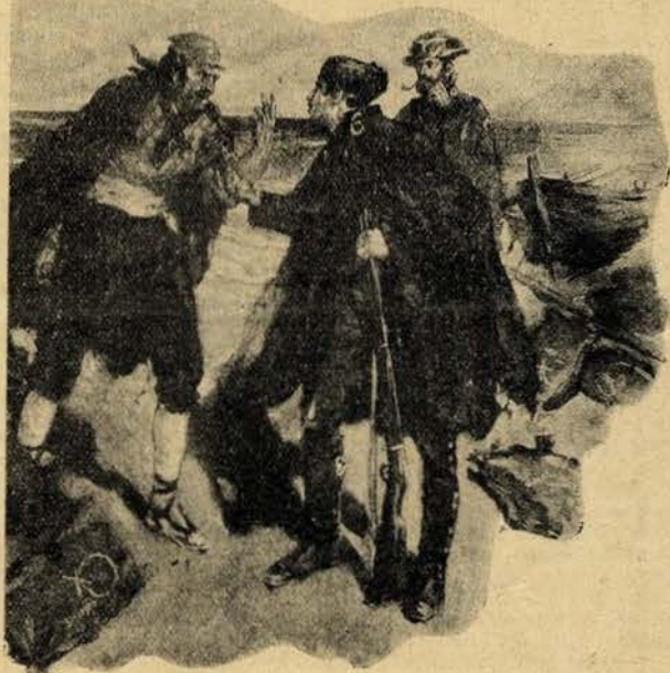
Yo me llamo Juan! — Gritou o contrabandista