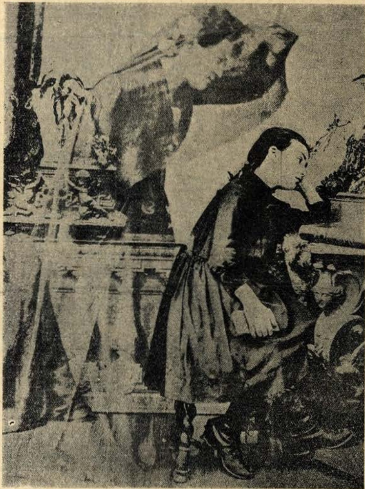
Fotografia tirada á luz do dia em Chicago—Aparição a Miss D... de sua mãe. Existem casos em que a chapa fotografica regista uma vaga forma, ligeiramente luminosa do fantasma, cuja vista escapa aos assistentes

notavel pela doçura do caracter e eminentes qualidades morais que a distinguíam, tendo falecido em Novembro de 1860. Pertencia a uma familia de mineiros, dos arredores de Saint-Etienne, circunstancia que torna interessante a sua posição espiritual — Evocação — R. Presente.