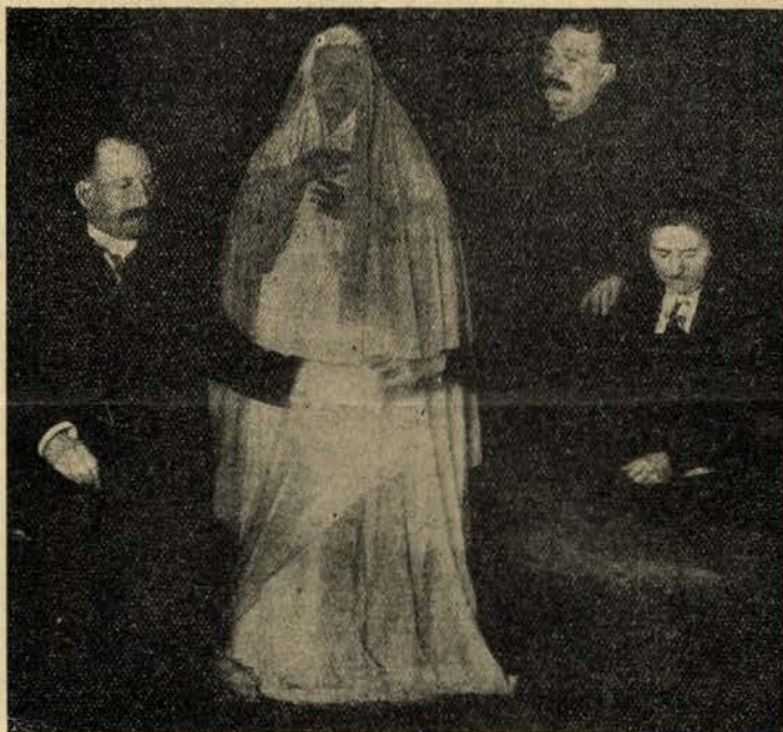
Fotografia feita a magnézium duma sessão de espiritismo. Uma materialisação

— Eu? — Sim o meu amigo. Nós encarnamos tantas vezes quantas forem precisas para que nos tornemos dignos d'Ele.