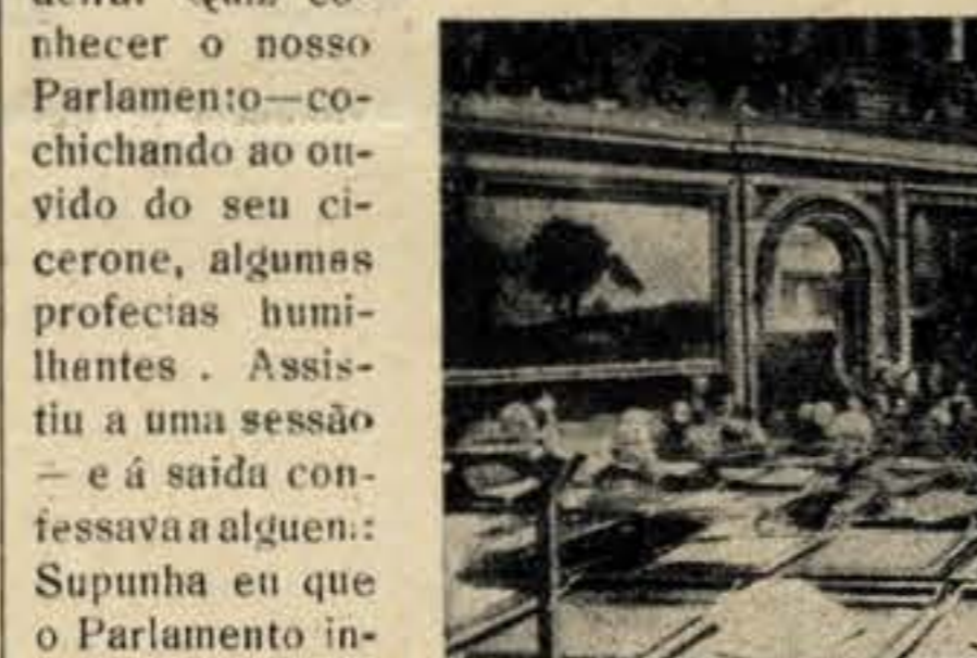
A única fotografia que existe do parlamento americano (Washington) — Este cliché valeu três meses de prisão ao auctor

Não queremos recordar os sacrificios que custou aos portugueses a sua Carta Constitucional — visto que todos eles são conhecidos do publico. Evocaremos, sim, o seu periodo mais brilhante, em que possuía oradores como José Estevam e Garrett. Um dia, Lord de Newcastle, que casara com uma fidalga espanhola e que compreendia e falava o nosso idioma, passou por Lisboa, a caminho da Madeira. Quiz conhecer o nosso Parlamento — cochichando ao ouvido do seu cicerone, algumas profecias humilhantes. Assistiu a uma sessão — e á saída confessava a alguém: Supunha eu que o Parlamento inglês era o mais elevado de todos pela sua riqueza oratoria. Pelo gozo dessa fama, Confesso agora que o vosso Parlamento, ao contrario do que eu previa, suplanta o nosso!