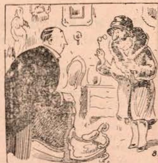
—Tem V. Ex.ª aqui um sofá estilo Luiz XIV. —Queria uma coisa maior. Assim, Luiz 40.