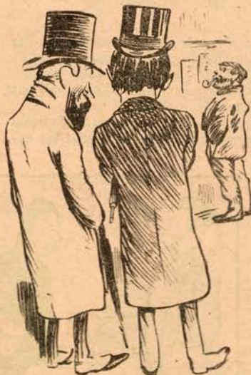
—Aquele tipo afirma que a criação do mundo foi obra dum sindicato.

Meu bom leitor, atenção! Vê se dás com isto tudo: A mulher tem-no na frente, Tendo-o algumas bem papudo.