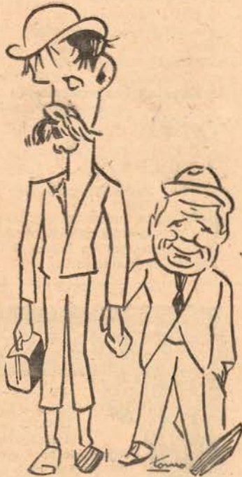
Pat e Patachon

São dois cómicos fotogénicos, havendo quem afirme que um é alto e outro baixo!