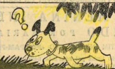
II — Mas, nisto, aparece um cão que, ao vê-lo, ladra: — «Ao-ão-ão!»