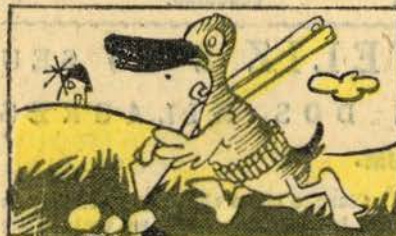
I — O patinho Cuá-Cuá-Cuá num êrmo caçando está...