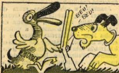
III — O patinho, atrapalhado, desata logo a fugir...