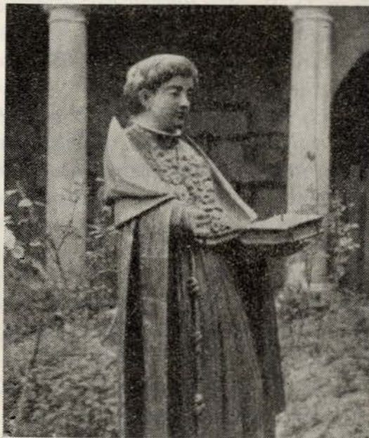
Escultura de madeira existente na Igreja de S. Francisco (Lamego): Santo António com vestes doutorais

O III Concílio de Latrão (1179), o nono Ecuménico, reunido por Alexandre III—aquele Papa que nos reconheceu definitivamente como nação independente —, exigiu que as paróquias, os mosteiros e as catedrais (o que até à data muitos já faziam por livre iniciativa) mantivessem escolas onde todas as classes sociais recebessem em comum instrução rudimentar, fundada mais no ouvido do que na leitura. O nosso Fernando, tal era o nome de baptismo do futuro Santo António, frequentou a escola catedrática da Sé de Lisboa, que ao tempo ministrava aula de Gramática e de Artes, e ali aprendeu as primeiras letras e rudimentos de humanidades. Teria uns quinze anos quando virou costas ao