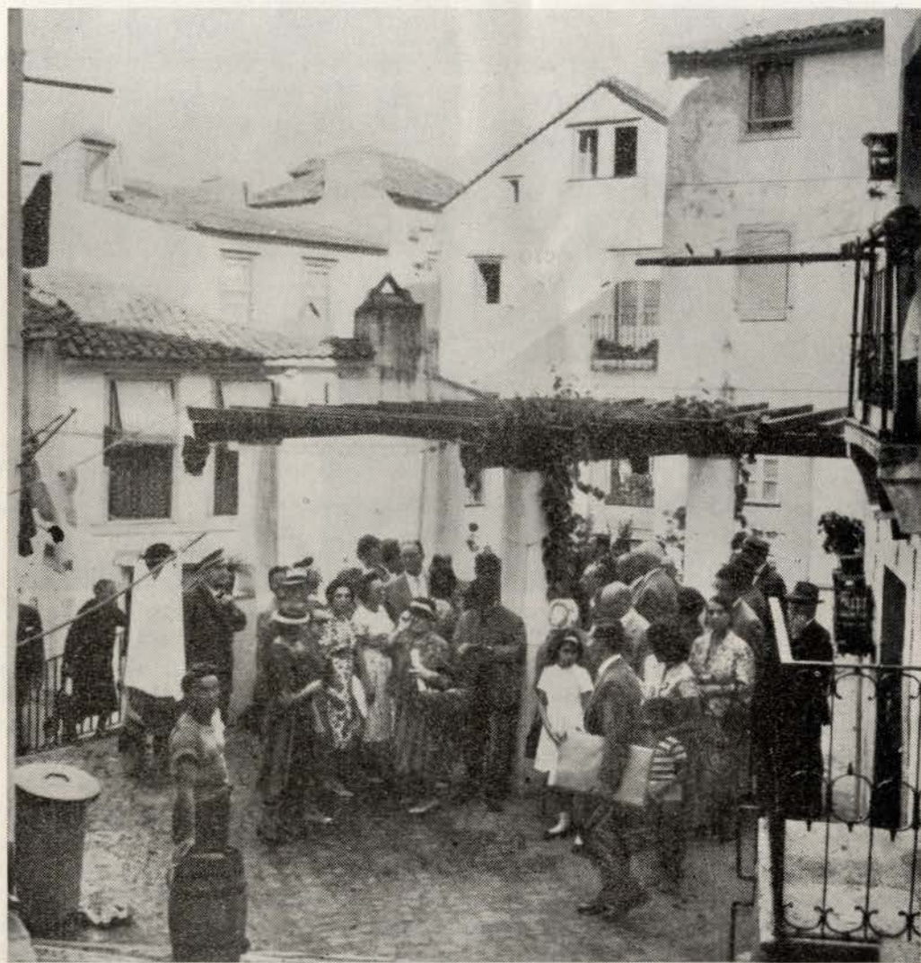
Os visitantes em Alfama

À ida seguiu-se o itinerário Arruda, Sobral, Runa e Cucos, para assim se ir flanqueando o trajecto das Fortificações das antigas linhas. Foram recebidos em Runa pelo Comandante e oficiais do Asilo dos Inválidos Militares e em Torres pelos Srs. Presidente da Câmara Municipal e Presidente da Comissão de Turismo que, gentilmente, os acompanharam em toda a visita, e no Convento do Varatojo pelo respectivo Superior. Foi distribuída a cada um dos visitantes uma pequena monografia sobre os locais visitados, editada pelo Grupo e