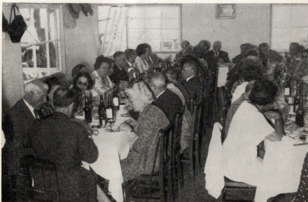
A assistência ao almoço do 25.º aniversário