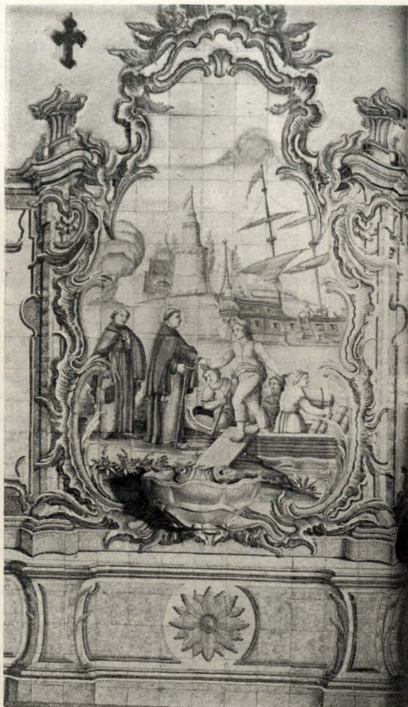
Santo António, havendo descido o vale que tem o seu nome, embarca para África (Marrocos) cerca de Santa Apolónia

(Painel de azulejos existente na capela de Nossa Se- nhora da Assunção e Santo António do Vale)