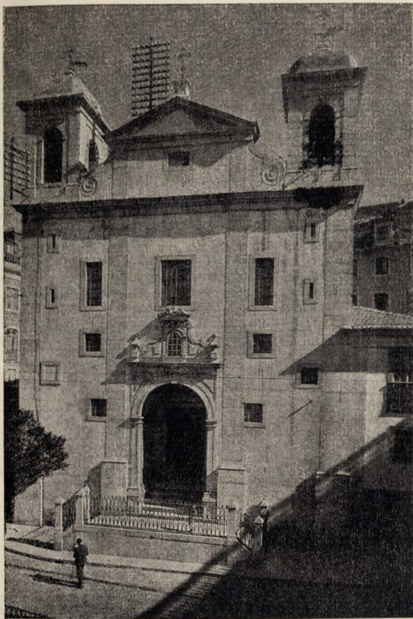
IGREJA DE S. CRISTÓVAO Fachada principal