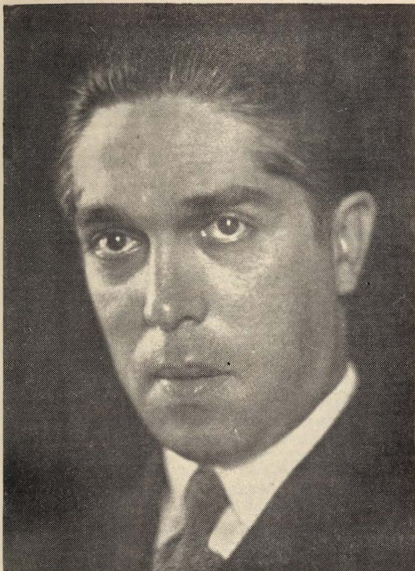
ENGENHEIRO DUARTE PACHECO

N A história da urbanização de Lisboa a personalidade do engenheiro Duarte Pacheco fica no primeiro plano dos seus agentes e dos seus animadores. O período do seu Consulado caracterizou-se por uma acção reflectida e contínua, e a capital que se atrazara no caminho da modernização, encerrada em si mesma, quási sem acessos que correspondessem às suas necessidades demográficas e ao seu movimento de grande cidade, civilizou-se com o benefício dêsse desafôgo essencial. Esta etapa de agora que corresponde aos grandes movimentos do tempo de D. João I, de D. Manuel e de D. José I, êste promovido por Pombal e os outros pelo Senado da Câmara, pertence inteiramente a esta figura de português que o soube ser com tôdas as características de energia, de iniciativa e de tenacidade.