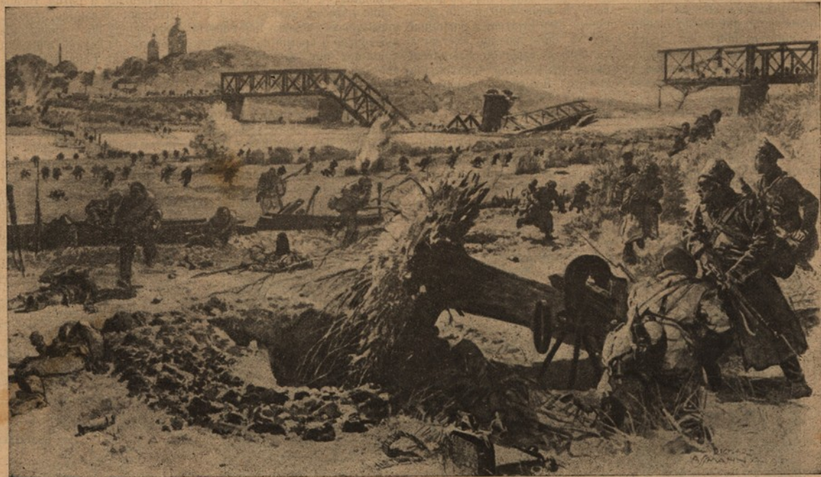
Epizodios da luta russo-germanica — Uma retirada tragica!

Uma semana em que se travaram mais batalhas diplomaticas do que de tropas e canhões. De facto, a resistencia que os aliados tinham a vencer no enigma neutralista tendencioso grego, preocupava, de momento, mais as atenções, do que os ataques sustidos e parados de artilharia e infantaria quer em Artois, nos Vosges e Hartmanuswiherkoff, quer nas regiões friorentas do Dwina, do Dwinsk, do Styr ou do Strypa.