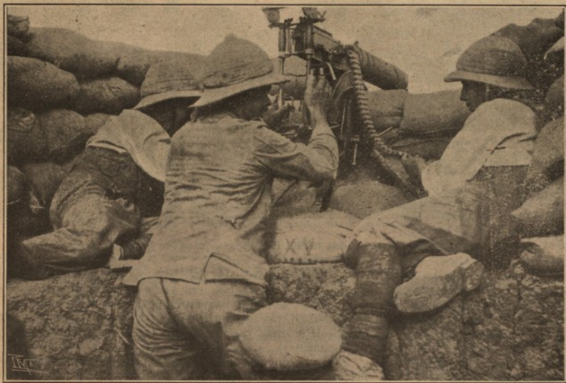
Soldados ingleses disparando uma metralhadora provida do pariscopio nos Dardanellos

o mar encapelado, largavam a manobra e de joelhos imploravam a protecção divina, deixando que o barco vogasse à mercê dos elementos desencadeados, parece querer expavorir todos, arrancando ainda aos mais optimistas a esperança de salvamento. E o nosso sonho anima-nos a soltarmos um grito de esperança a tentarmos um esforço para que a crença renasça nesta sociedade a que a desgraça parece ter arrancado as mais belas condições de resistencia.