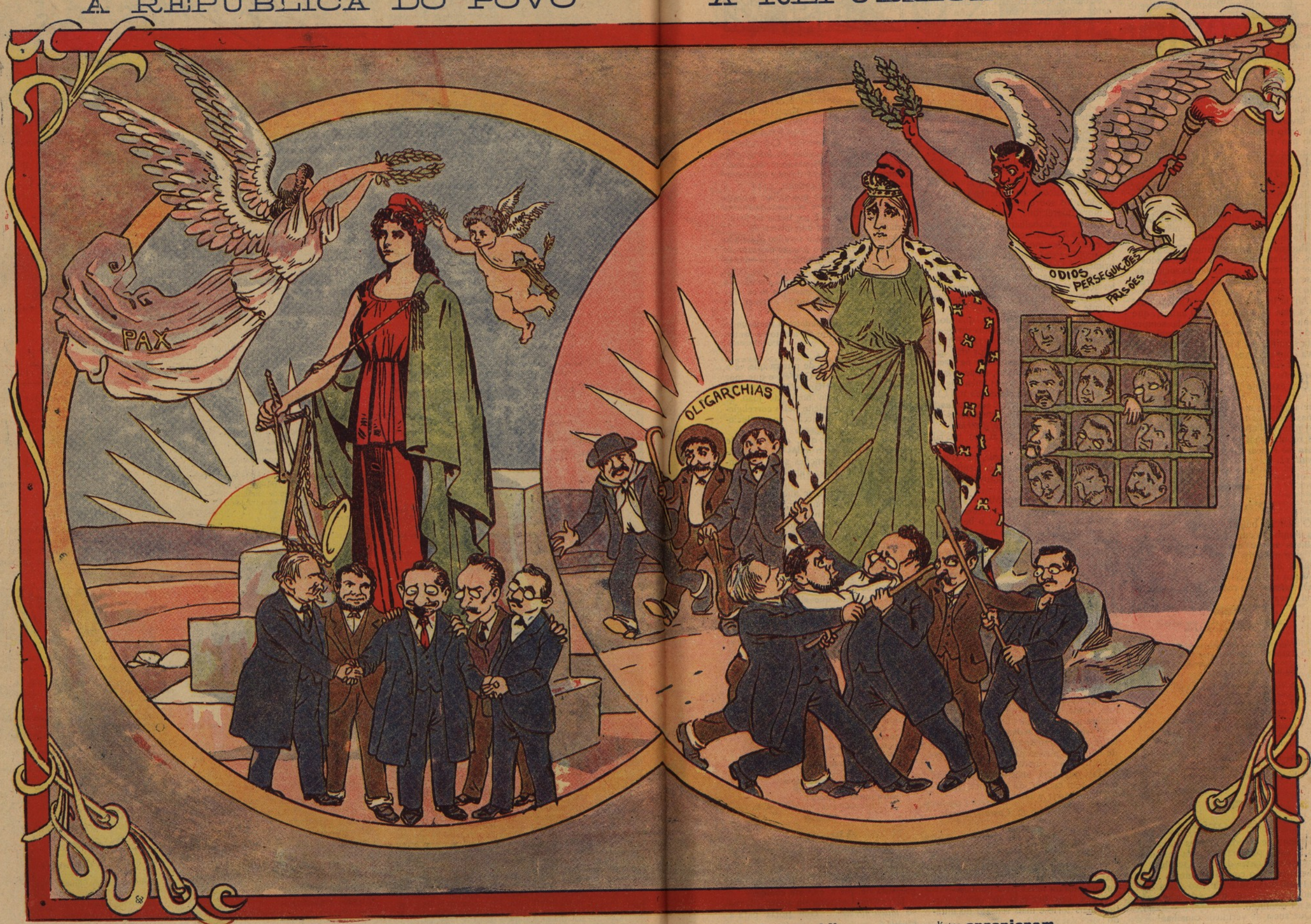
Esta é a Republica que os bons republicanos sonharam