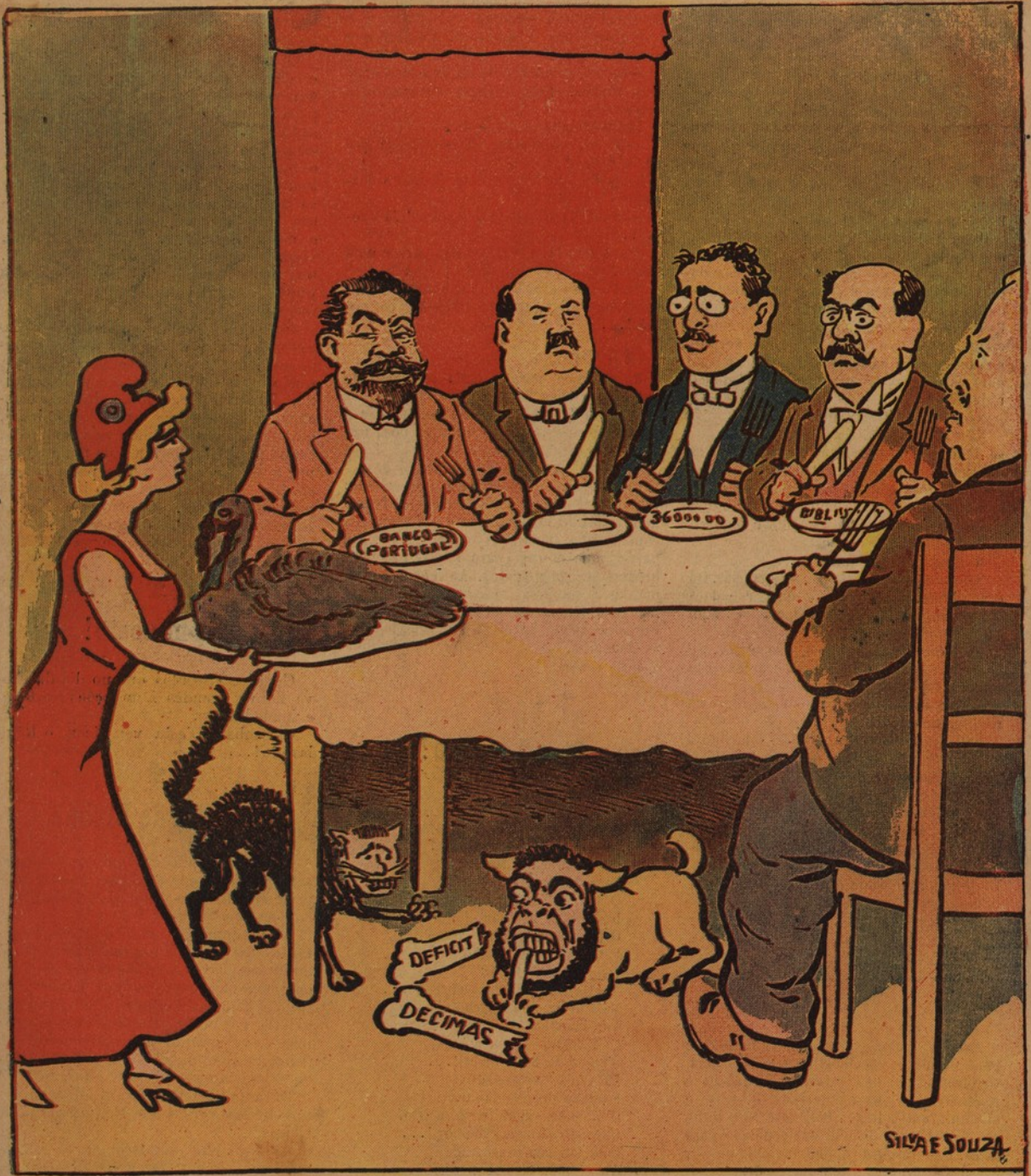
Digam lá, que não são estes os magicos felizes da festa do... Natal. E para o Zé, lá estão os duros ossos