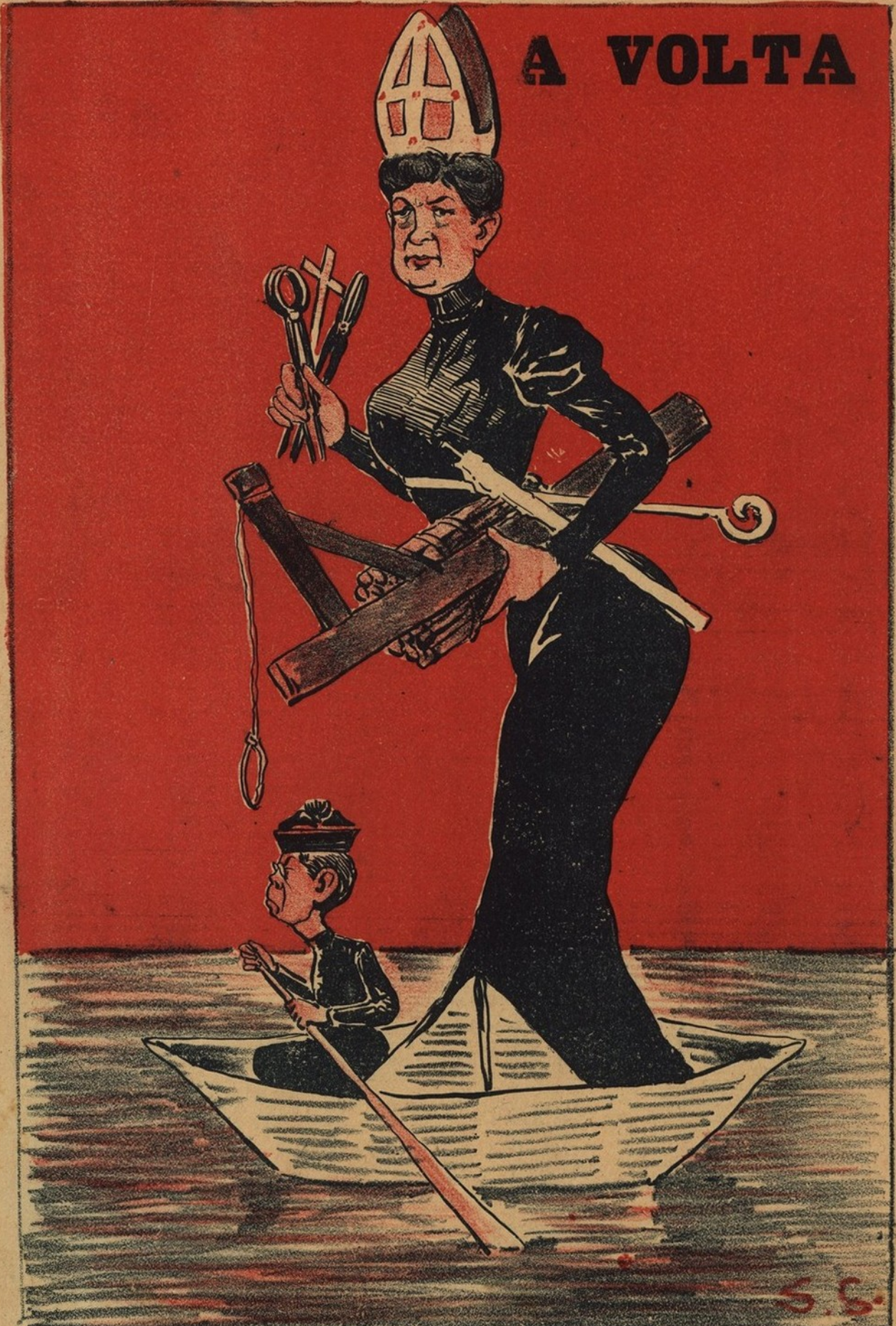
PALAVRA DE RAINHA, ELLA AHI ESTA