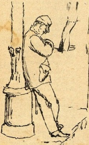
Para este dormir com socego