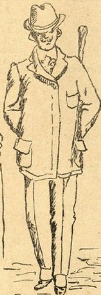
O que pensa... que pensa