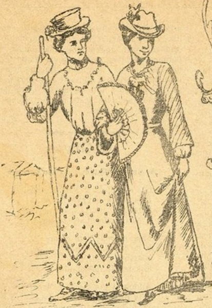
Para estas procurarem marido