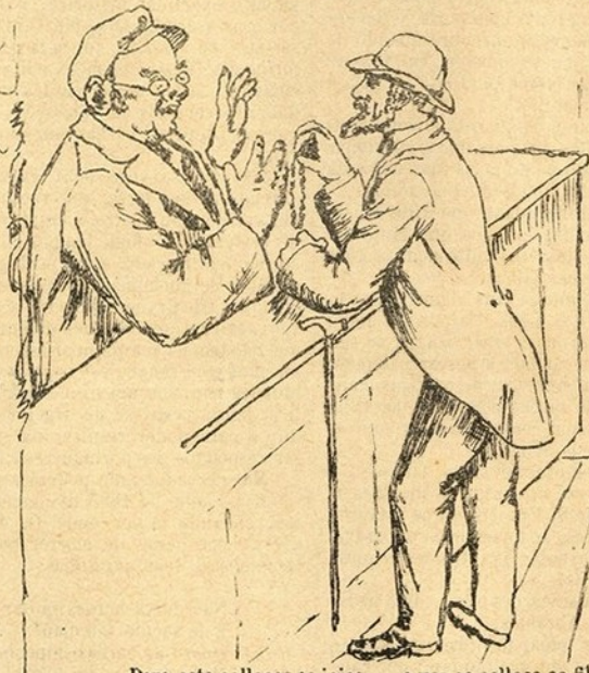
Para este collocar as joias... a ver se colloca as filhas —ne praia