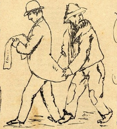
Para este exercer tranquillamente a sua profissão