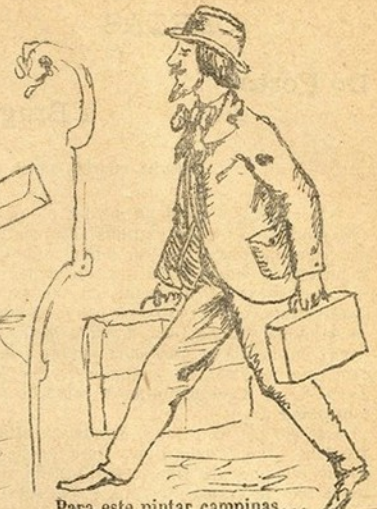
Para este pintar campinas... de que hade comer