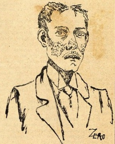
Para os humores do sangue mancharem a nivea cntis d'este formoso rosto.