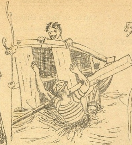
Para estes se lavarem ... involuntariamente