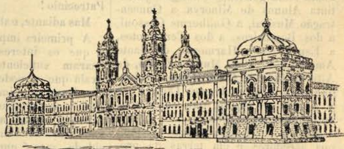
MARCA - MOSTEIRO DE MAFRA