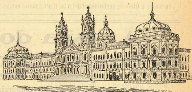
MARCA - MOSTEIRO DE MAFRA