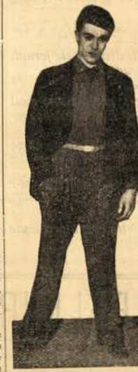
Mareta o jogador! Um parvo parvo que andava por Belém, simpático e mareto