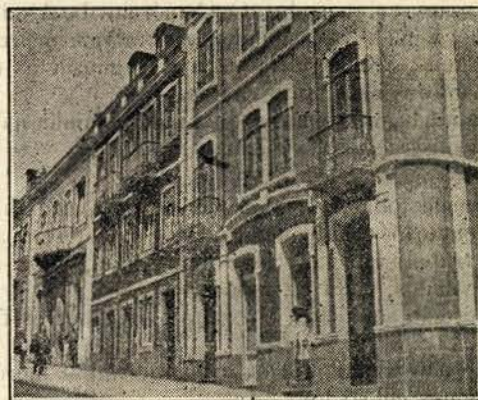
Um trecho da Calçada da Ajuda. No primeiro plano, a leitaria Zenida

Dedica-se também á agricultura, sendo até um dos maiores lavradores destes arredores.