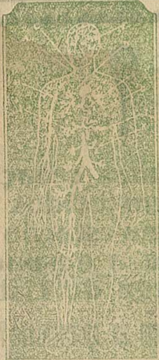
A. carótida; B. estômago; C. fígado; D. v. cava superior; E. coração; F. temporal; G. pulmão; H. v. inferior; I. fígado; J. braço; K. rim; L. intestino; M. gânglios linfáticos; N. bexiga.

URODONAL EVITA E CURA O ARTRITISMO porque dissolve o ácido úrico