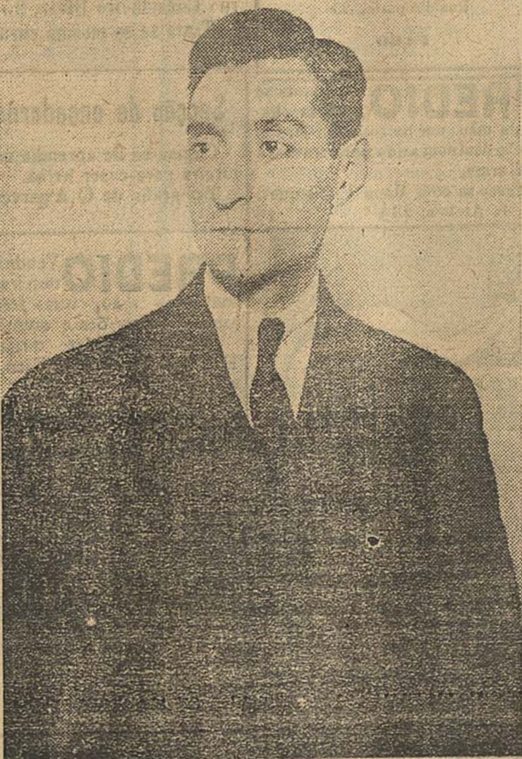
dr. Oliveira Salazar

Este eminente estadista, autentica gloria nacional, e hoje a unica esperanza do paiz, acaba de entrar para o novo governo. A sua entrada para o governo prova quanto ele ama o paiz, pois que o seu estado actual de saude exigia um largo repouso. Longo depois da queda do ministerio, quasi todo o paiz indico ao illustre Presidente da Republica, que vem ocupando o seu alto cargo com grande criterio, que do novo governo devia fazer parte o notavel estadista Oliveira Salazar, devendo todo o ministerio ser mais ou menos orientado pelo illustre estadista, pedindo assim ao professor Salazar mais um sacrificio. E' isto que se ouvia por todo o Algarve e julgo, pelo que li nos jornaes de Lisboa, por todo o paiz. O sr. professor Salazar, pela sua intelligencia e saber, é hoje a unica esperanza do paiz. Sem elle a Dittadura pouco poderia viver e creio que tambem esta é a impressão do illustre presidente do ministerio, o sr. General Ivens Ferraz, pois que S. Ex.ª, antes