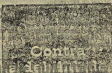
Farmacia Pedreira, Farmaceutica da Farmacia Franco

Esta farinha é um precioso medicamento para a acidez gástrica, indigestão, do mais reconhecido proveito nas pessoas anemicas, de constituição fraca, e, em geral, que carecem de forças no organismo, e ao mesmo tempo, em excelente alimento reparador, de facil digestão, utilissimo para pessoas de estomago debil ou enfermo, para convalescentes, pessoas idosas ou crianças.