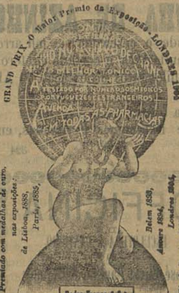
Petro France & C. Rua de Belem, 147 - LISBOA

GRAND PRIX EXPOSITIO. LONDRES 1904. Xarope Peltoral James Deposito Geral: FARMACIA FRANCO, FILHOS RUA DE BELEM, 147 - LISBOA