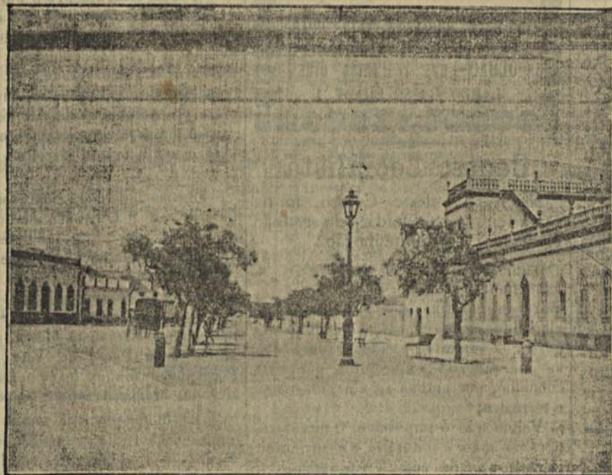
OLHÃO - AVENIDA

Tem hoje lugar na parada do quartel do 3.º batalhão de infantaria n.º 4 a solenidade da encorporação dos recrutas do 1.º contingente do corrente anno, festa esta, que costuma ser feita na presença das autori-