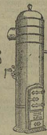
sq. m. para banho

Executam-se todos os trabalhos relativos a industria de latoeiro de folha branca e pintada tanto para esta cidade como para toda a provincia.