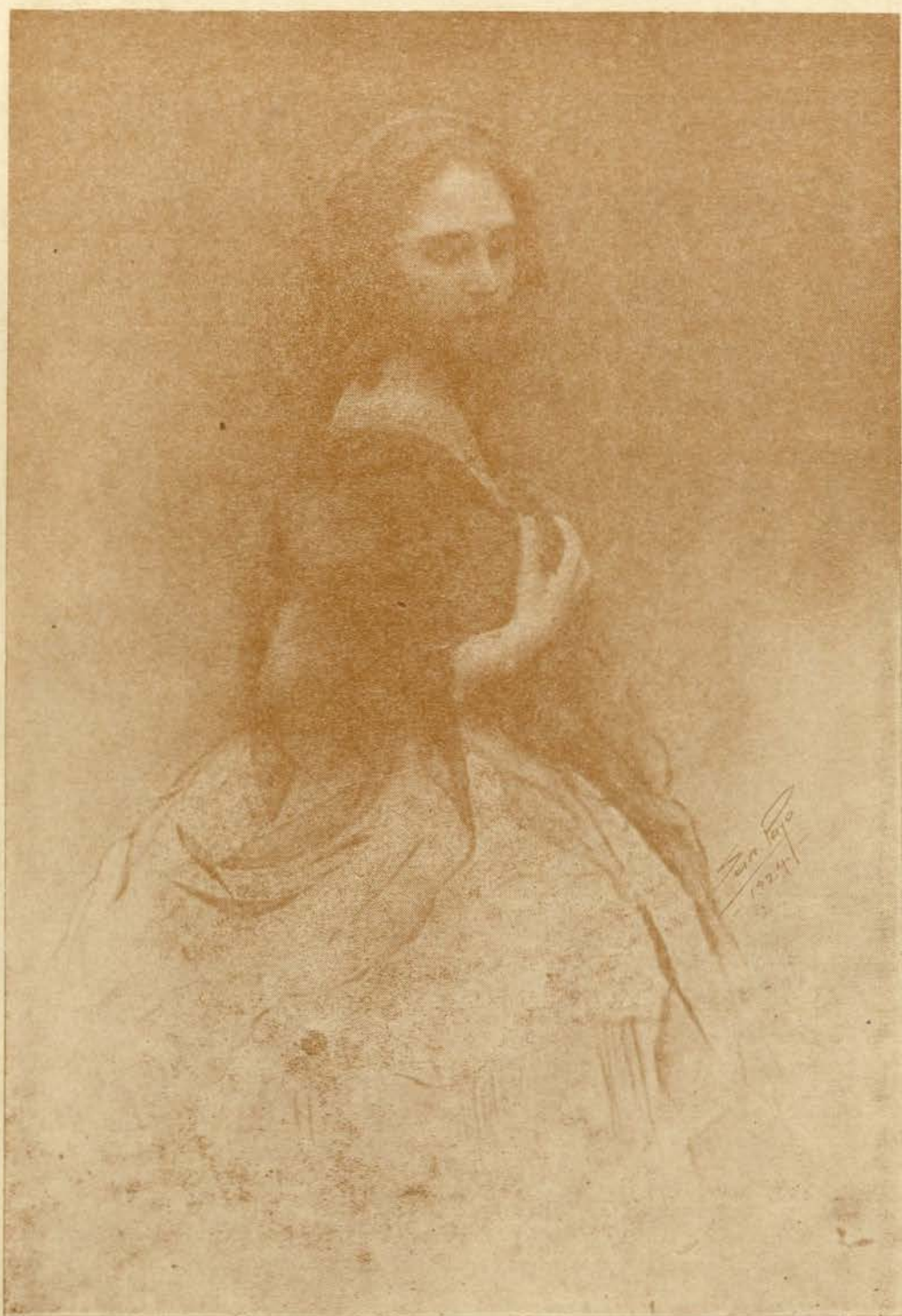
Reprodução de um trabalho de Alves-San-Payo