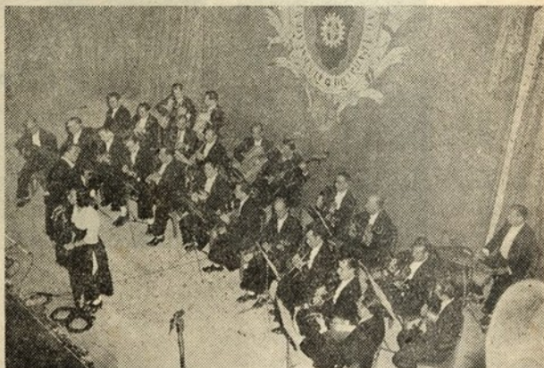
ORQUESTRA TIPICA PORTUGUESA