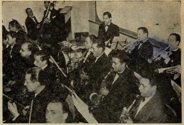
ORQUESTRA TAVARES BELO