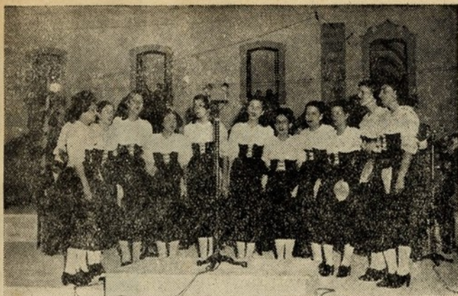
CORO FEMININO DA E. N.