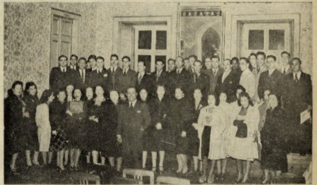
CORO POPULAR DE LISBOA