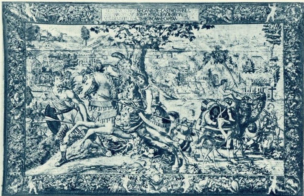
Cêrco de Diu, 1546 — Tepeçaria de armação da História de D. João de Castro. Existente no Museu de Viena

— Senhor D. João, teimo em crer que sim. Cambaia não é