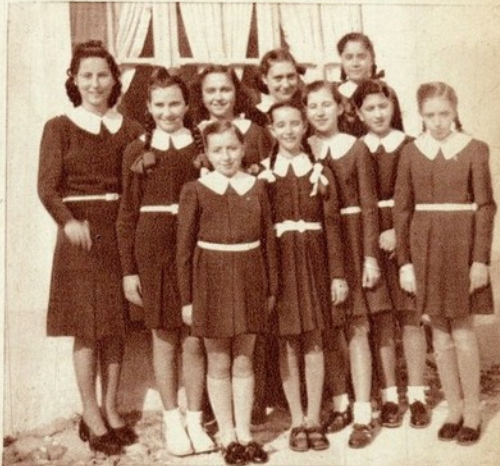
AVEIRO: Filiadas do Centro n.º 3