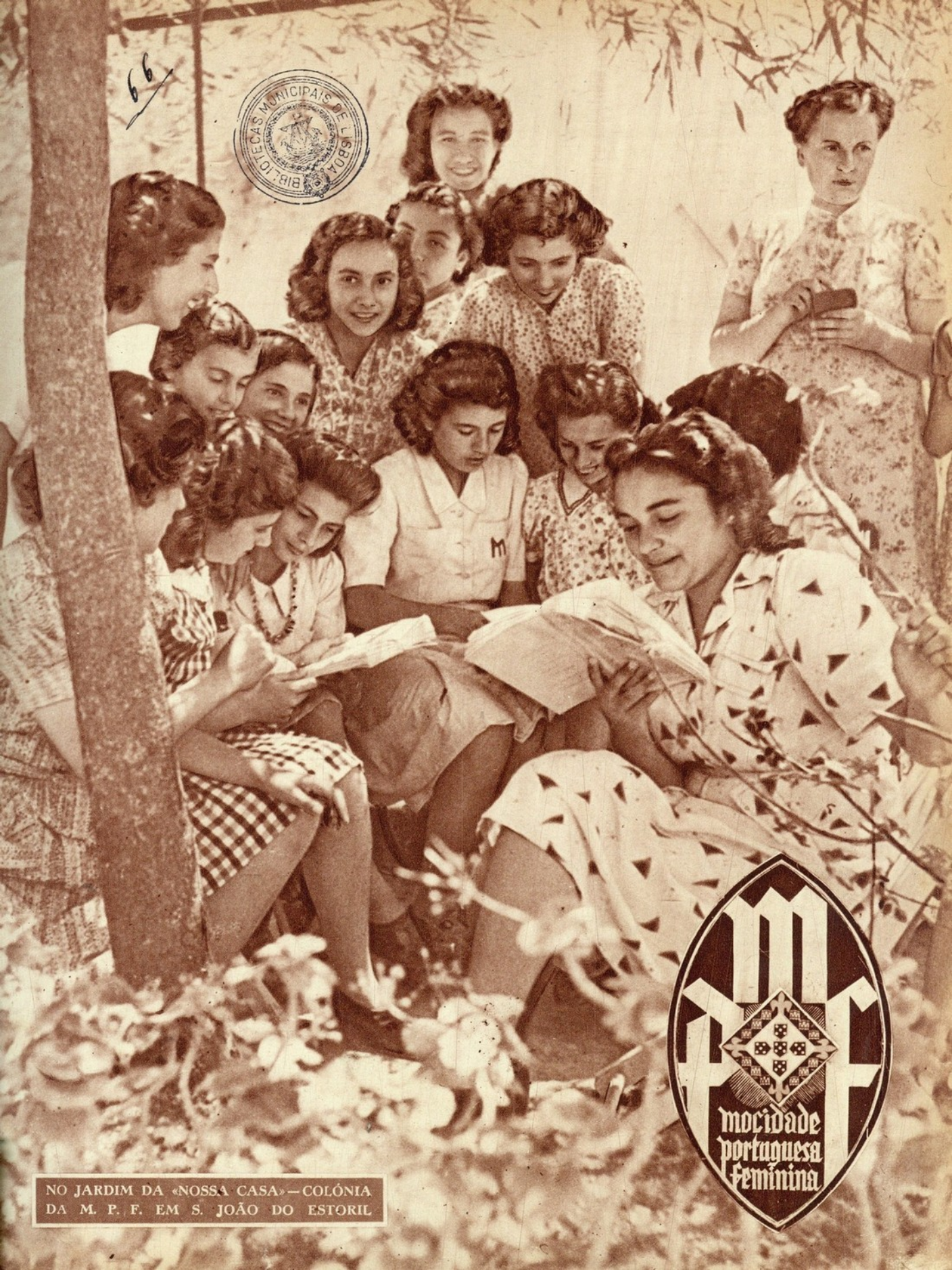
NO JARDIM DA «NOSSA CASA» — COLÓNIA DA M. P. F. EM S. JOÃO DO ESTORIL