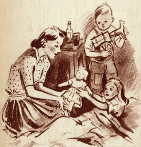
Quando lhe dei a boneca parecia doidal!

A Prima Serafina, então, entrou em explicações detalhadas sobre as vanta-