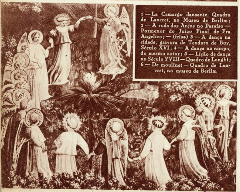
1 — La Camargo dansante. Quadro de Lancert, no Museu de Berlim; 2 — A roda dos Anjos no Paraíso — Pormenor do Juizo Final de Fra Angelico; — (friso) 3 — A dança na cidade, gravura de Teodoro de Buy, Século XVI; 4 — A dança no campo, do mesmo autor; 5 — Lição de dança no Século XVIII — Quadro de Longhi; 6 — De moulinet — Quadro de Lancert, no museu de Berlim