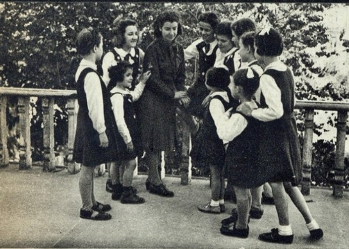
Propaganda da M. P. F.