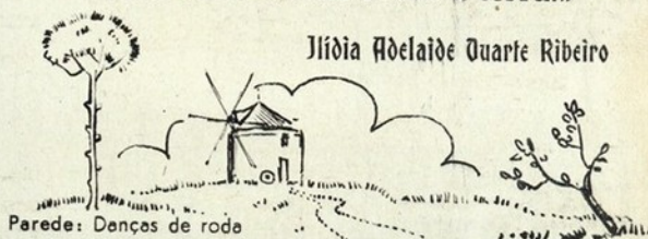
Parede: Danças de roda

«Eu amo, eu canto e eu creio ... E eu sou feliz sôbre a terra.»