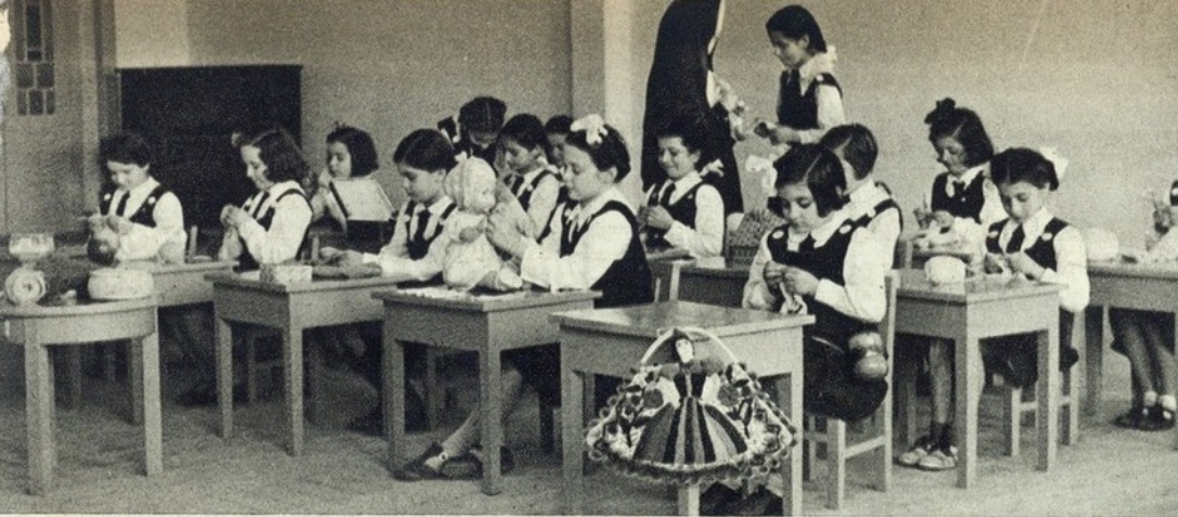
Lusitas e Infantes na aula de trabalhos manuais

Graduada —ao rasto da tua clari- dade, muitos encontra- rão o rumo que conduz da Terra ao Céu: