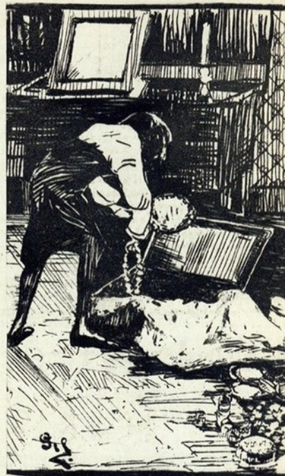
Era um nunca acabar de coisas elegantes...

Começou, então, para Maria da Luz uma vida bem mais alegre do que fôra até ali. A certeza de que seu pai ainda era deste mundo, as provas que tivera do seu interesse, da sua ternura, e a ideia da