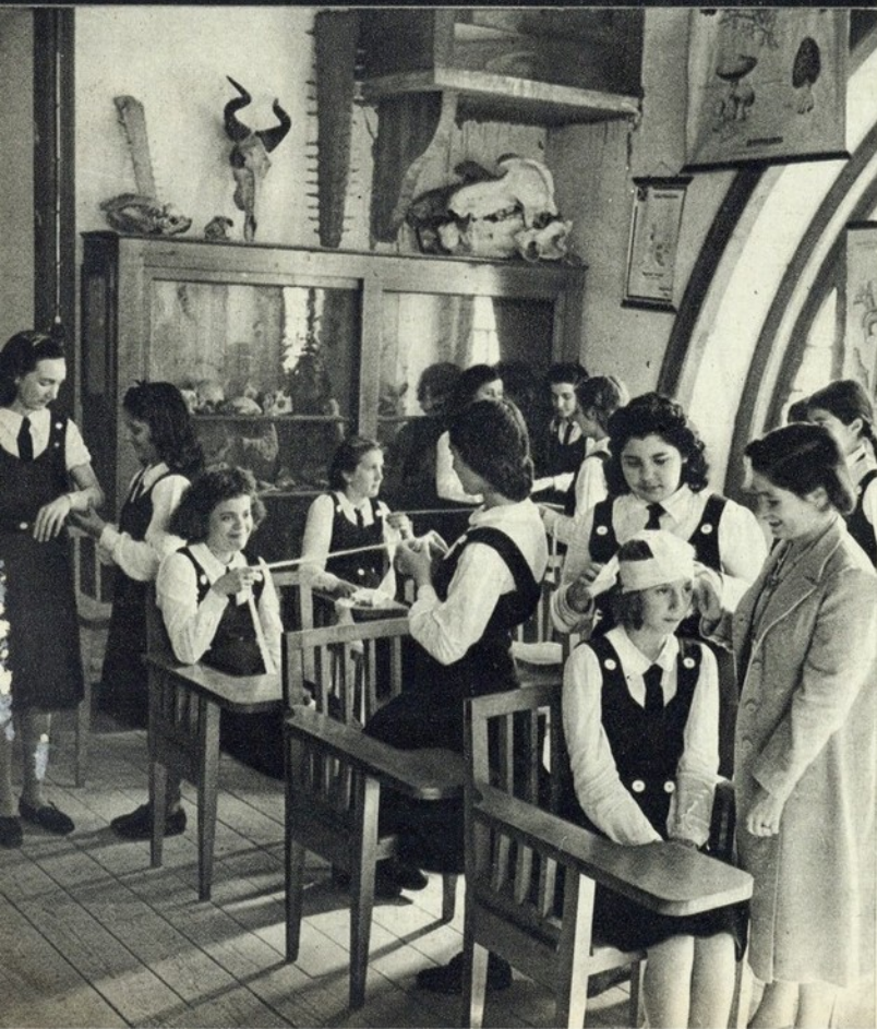
Vanguardistas e Lusas, na aula de 1.ª socorros

Filiadas — A caminho, vivendo em Es- perança !!