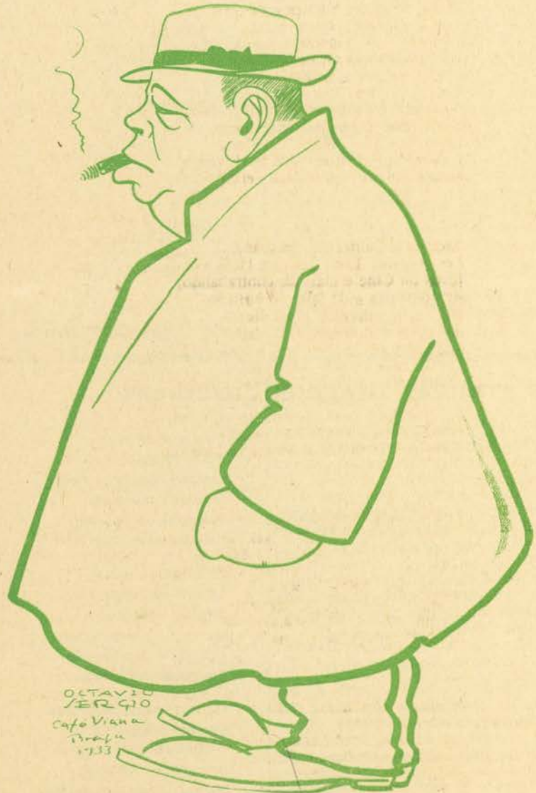
Um Senhor que ocupa dois têrços da Arcada...