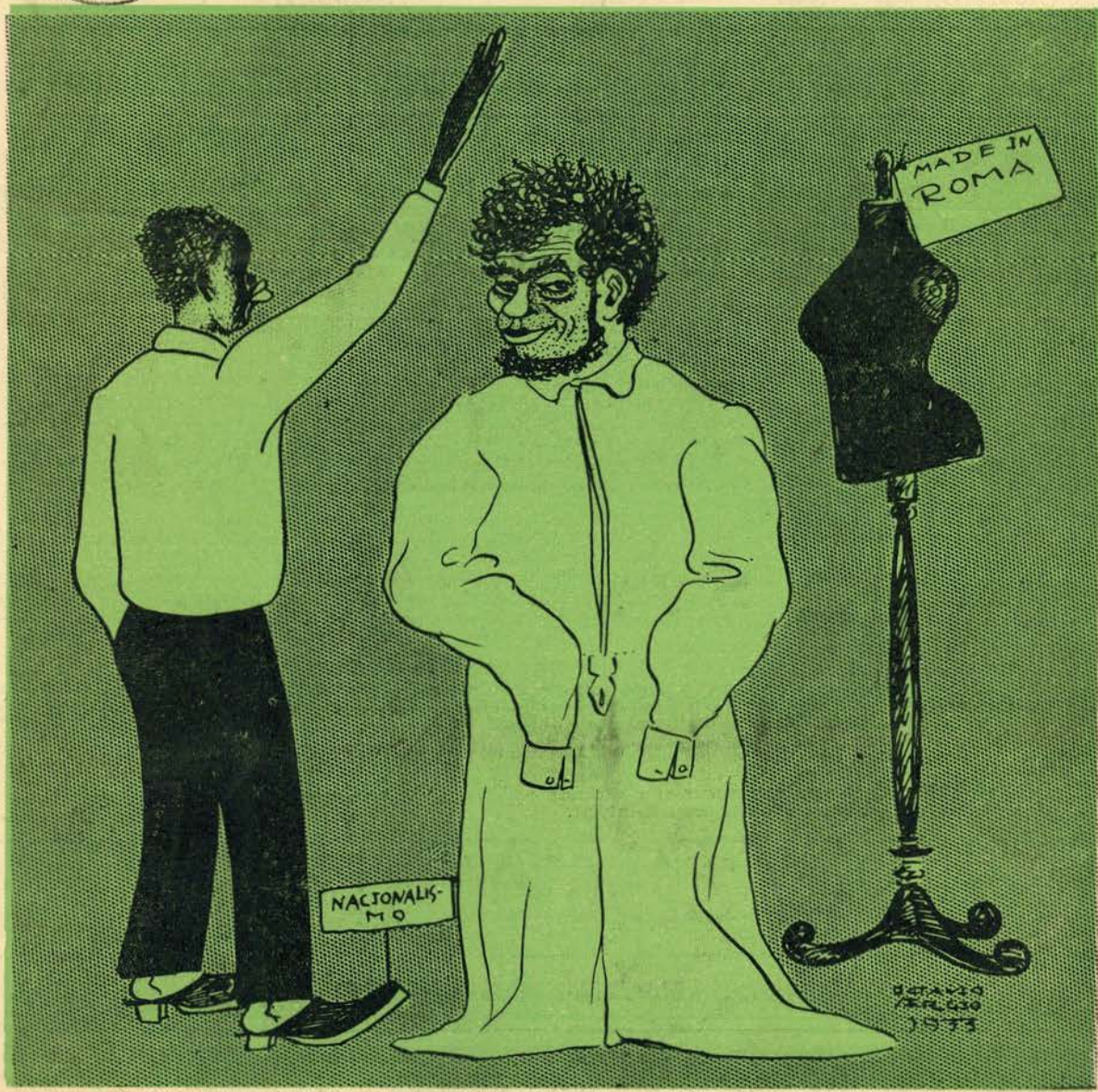
Zé Povinho — Vocemecê desculpe, mas eu não posso levantá-los braços...