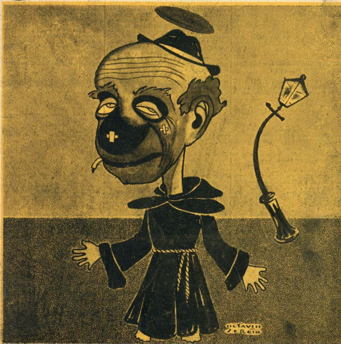
... advogado das eleições, das piolas e das carraspanas. Uma espécie de Santo Condestabre da sede lusitana