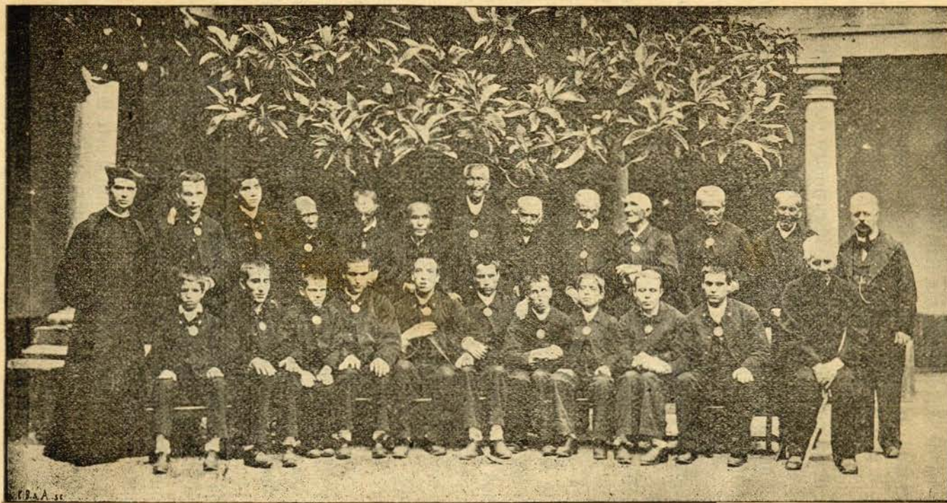
GRUPO DOS ASYLADOS CEGOS COM O REGENTE E SECRETARIO DA ADMINISTRAÇÃO DO ASYLO DOS CEGOS DE CASTELLO DE VIDE