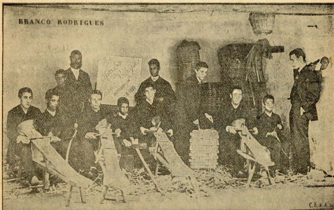
OFFICINAS BRANCO RODRIGUES