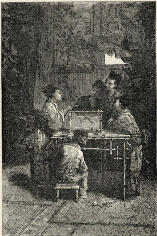
... divertimento favorito das meninas japonezas

— Telegramma quer dizer : escripto que vem de longe ; e é sómente o escripto que vem, não o papel. Se não fosse assim, nunca mandaríamos as nossas cartas pelo correio, mas sim pelo telegrapho, que é muito mais rapido.