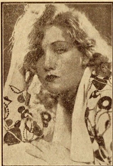
Edwina Booth a intérprete de «Trader Horn»

Não queria exigir muito sobre essa teoria, onde a vulgaridade e a mentira imperavam com pavor.