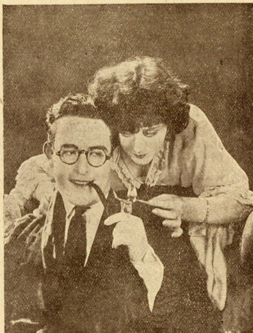
Harold Lloyd e a sua inseparavel «cara metade»

E' esta a felicidade que se procura «instituir» nas fronteiras da Califórnia com o México.»