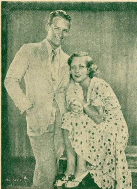
Joan Crawford e seu marido Douglas Fairbanks Jnr.

Só não posso compreender um bem casado como George Bancroft, dizer que a mulher americana não se preocupa com a questão de sexo.