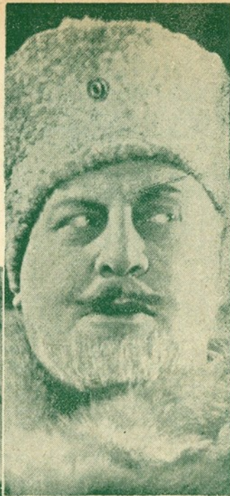
Três belas máscaras do grande Emil Jannings

Down-Town possui o seu bairro russo, o chinês, o mexicano, é, enfim, uma verdadeira Torre de Babel moderna.