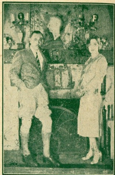
John Barrymore e sua mulher Dolores Costello

Joan Crawford tem as mais belas teorias sobre o amor, através da publicidade. Pessoalmente disse algumas, as quais, mentalmente, comparando à sua vida de casada, pareciam que andavam em paralelos.