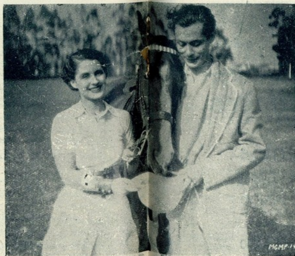
Norma Shearer e Robert Montgomery

Karen Morley conseguiu entrar para o cinema enquanto esperava ser atendida no departamento de elencos da M. G. M., afim de ver se conseguia trabalho como extra. Clarence Brown necessitava de uma jovem para ler o diálogo com Robert Montgomery para uma prova dum filme, e ela então foi enviada aos cenários sonoros afim de fazer