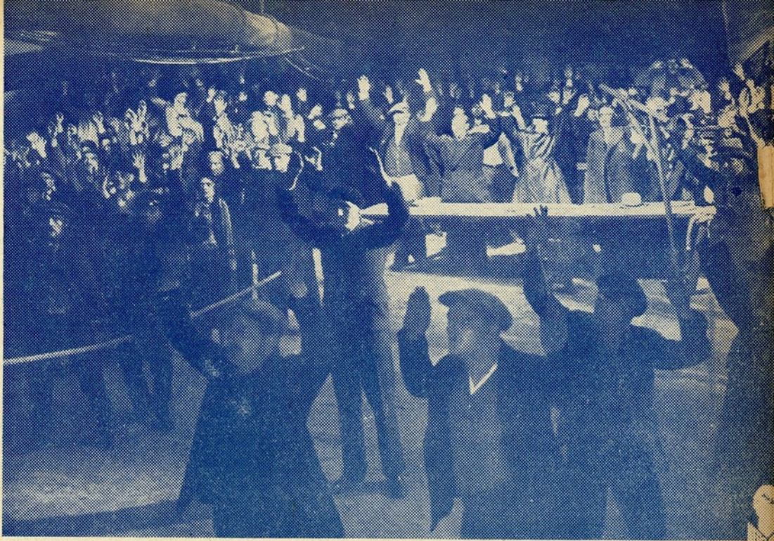
Uma imagem do grande fonofilme «Matou!»

«Técnicamente, é impossível conceber uma estreia de realização sonora com uma tão perfeita segurança. Desde os primeiros aos últimos planos—desde a enternecedora cena das crianças brincando no pateo, ao tribunal dos bandidos na fabrica velha—não mostra uma