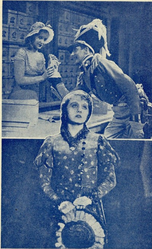
Imagens de «O Congresso que Dança» e «Opera de 4 vintens».